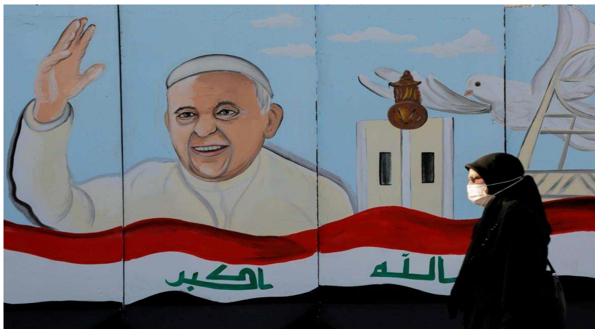
Slika 5, https://www.dw.com/hr/papa-franjo-u-iraku/a-56771618 SABAH ARAR/AFP/GETTY IMAGES