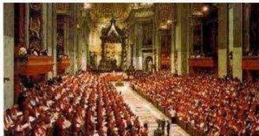
Slika 1 , Drugi vatikanski koncil, papa Ivan XXIII.