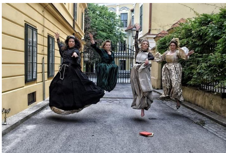
Slika 11. Gornjogradske coprnice

Gornjogradske čarolije su iznimno uspješan projekt male tvrtke Omnes artes d.o.o., koja se bavi izvedbenom umjetnošću. Slogan tvrtke sadržan je u samom nazivu i predstavlja raznolikost svih umijeća koje najbolje prikazuju projekti poput Gornjogradskih čarolija, Iz Zagorkina pera i najnovijih Neznanih junakinja. Projekt Gornjogradske čarolije postoji od 2013. godine, a počeci su bili skromni. Ideju je pokrenula tvrtka Omnes artes uz podršku Muzeja grada Zagreba i Turističke zajednice grada Zagreba. U početku su obilasci održavani tijekom dana, bez raskošnih kostima i glumaca. Međutim, od samih početaka su se trudili ponuditi nešto više, pa je obilazak završavao u Muzeju grada Zagreba s posjetom izložbi vezanoj uz progon vještica te kreativnom radionicom u muzeju. Od prvih sezona stavljali su naglasak na posjetitelje i na načine kako obogatiti njihovo iskustvo, pa su pored poklona za sudionike, uveli i posudbu vještičjih šešira u tijeku trajanja obilaska, kako bi ih što više uključili u priču. Uvođenjem likova, također se otvorio novi prostor za interakciju posjetitelja s glumcima. 23