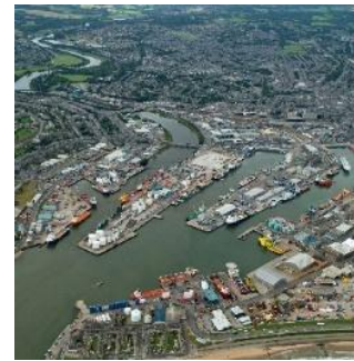
Slika projekta Aberdeen Harboura 1

Projekt luke Aberdeen je proširenje i rasčlanjenje postojećih mogućnosti luke radi preobrazbe u kompleks zgrada marine u Škotskoj. Projekt proširenja je vrijedan 350 milijuna funti i uglavnom će uključivati nove komplekse zgrada u Nigg Bayu koje će biti locirane južno od postojeće luke. Škotska vlada je odobrila plan proširenja još u prosincu 2016. godine, a gradnja je započela 2017. godine u sklopu National Planning Framework 3 izgradnje i predviđa se da će projekt biti dovršen sredinom 2020. godine.