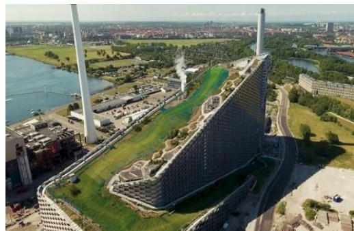
Slika projekta Copenhagen Inciniratora 1

Čudo od projekta, tako bismo mogli nazvati izgradnju najveće i najbolje spalionice smeća u Europi, čija je tendencija razvoja daleko ispred drugih.