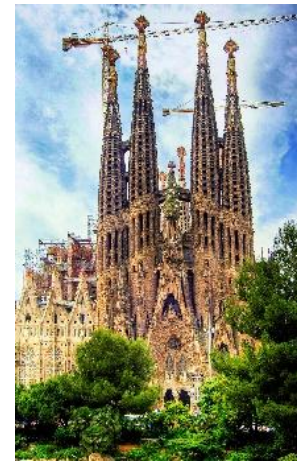
Slika projekta Sagrade Familiae 1

Prije svega, treba spomenuti čovjeka koji je dizajnirao i osmislio samu baziliku i ostavio gradu Barceloni projekt kao svoje nasljedstvo, a koje se pretvorilo u jednu od najimpresivnijih građevina današnjice, a još se uvijek gradi. Njegovo ime je Antoni Gaudi. Antoni se školovao u gradu Reus gdje je odmah pokazao talent za geometriju i arhitekturu i gdje će razviti neka od svojih spektakularnih djela. Gaudi je Sagradu Familiju počeo graditi na način da je eksperimentirao s nosivošću materijala da utvrdi koji će biti izdržljiviji, a to se pokazalo kao uspješna metoda koju su nastavili primjenjivati nakon njegove smrti. Neke od najvažnijih građevina koje je Gaudi konstruirao i izgradio osim Sagrade Familie nalaze se u Barceloni, kao na primjer: Park Güell, Casa Vicens, Casa Batlló, Casa Milà, Casa Calvet, Torre Bellesguard and Col·legi de les Teresianes. Osmislio je i mnogo drugih projekata, ali ove su građevine najvažnije.