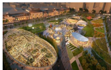
Slika projekta podzemnog trg. centra 1

Ovaj projekt bazira se na prirodnoj katastrofi koja se dogodila prije desetak godina. Tada se blizu samog centra Moskve uz Paveletsky željezničku stanicu stvorila ogromna jama koja se punila vodom nakon kišnih razdoblja i