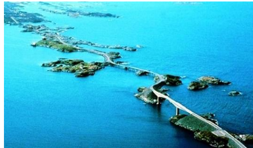
Slika projekta Coastal Highway Route 1

Ovo je projekt izgradnje autoceste E39 koji će dužinom od 1 100 kilometara spajati zapadnu obalu Norveške, sve do krajnjeg sjevera (Trondheim) pa do Christiansanda na jugu, odnosno do mosta koji Norvešku spaja s Danskom i zapadnom Europom.