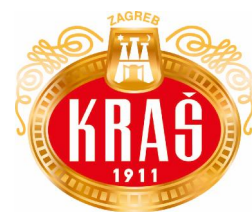
Logo Kraša 1

Kraš prehrambena industrija d.d. iz Zagreba svoju povijest započinje 1911. godine kao tvornica Union i to kao prvi industrijski proizvođač čokolade u jugoistočnoj Europi. Union ubrzo postaje carski i kraljevski dobavljač bečkog dvora, što je u ono vrijeme bila najbolja moguća referenca. U 1923. godini tvrtka Bizjak na Savskoj cesti u Zagrebu počinje s proizvodnjom vafli, keksa i dvopeka, te ubrzo postaje značajan faktor u regiji. Nakon Drugog svjetskog rata odnosno od 1950. godine tvornice Union i Bizjak te još neki manji proizvođači ujedinjuju se pod imenom Josipa Kraša koji je bio istaknuti antifašistički borac i rukovodilac sindikalnog pokreta. Josip Kraš nastavlja razvijati tri grupe konditorskih proizvoda: kakao proizvodi, keksi i vafli te bombonski proizvodi. Od 1992.