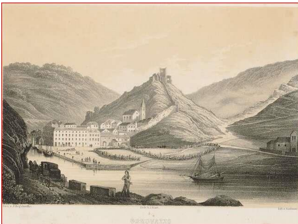
Slika 3: Povijesni prikaz grada Obrovca