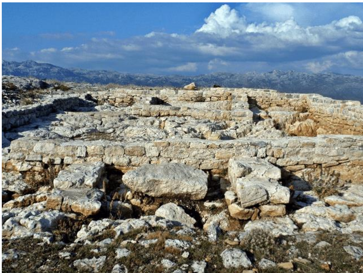
Slika 20: Cvijina gradina

20. stoljeća. Tijekom tih istraživanja, otkriven je hram dimenzija 11,4 m × 6,65 m, čiji su zidovi bili očuvani do visine od 0,70 m do 0,80 m. Također su pronađeni kameni orao i skupina skulptura Jupitera, kao i kupališni kompleks (terme) i dio građevinskog kompleksa s pripadajućim ulicama. Od 1999. godine, Arheološki muzej grada Zadra provodi sustavna arheološka istraživanja na tom lokalitetu. 15