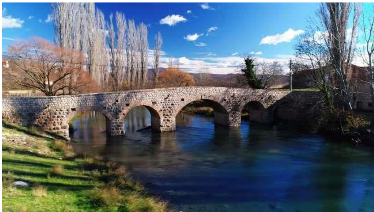
Slika 25: Donji most