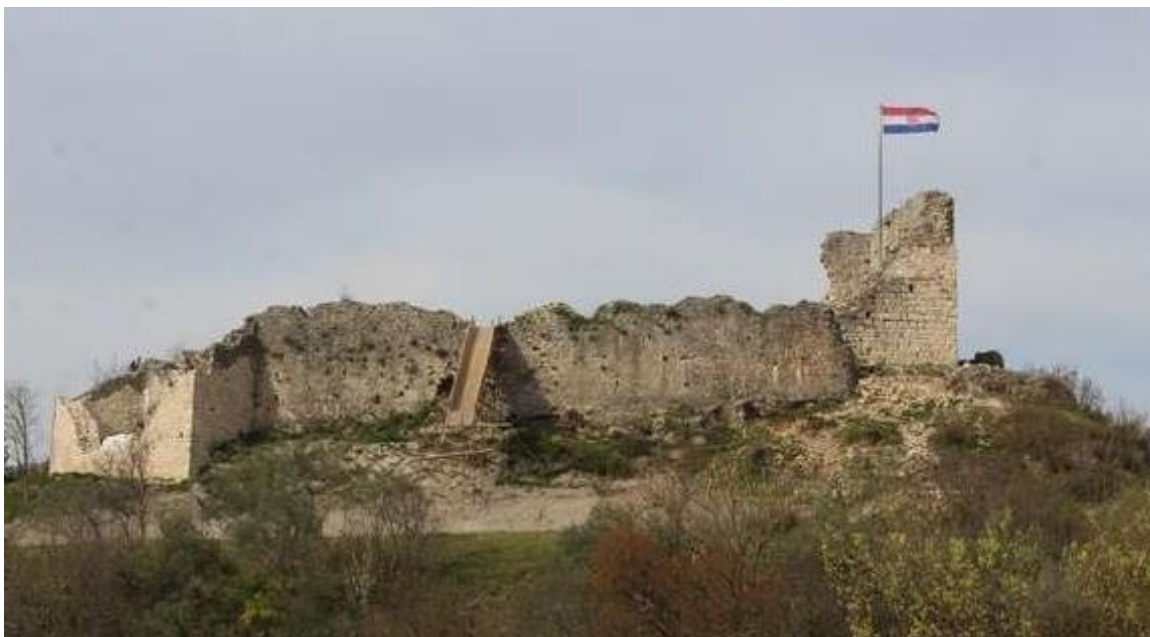
Slika 16: Tvrđava Kurjakovića