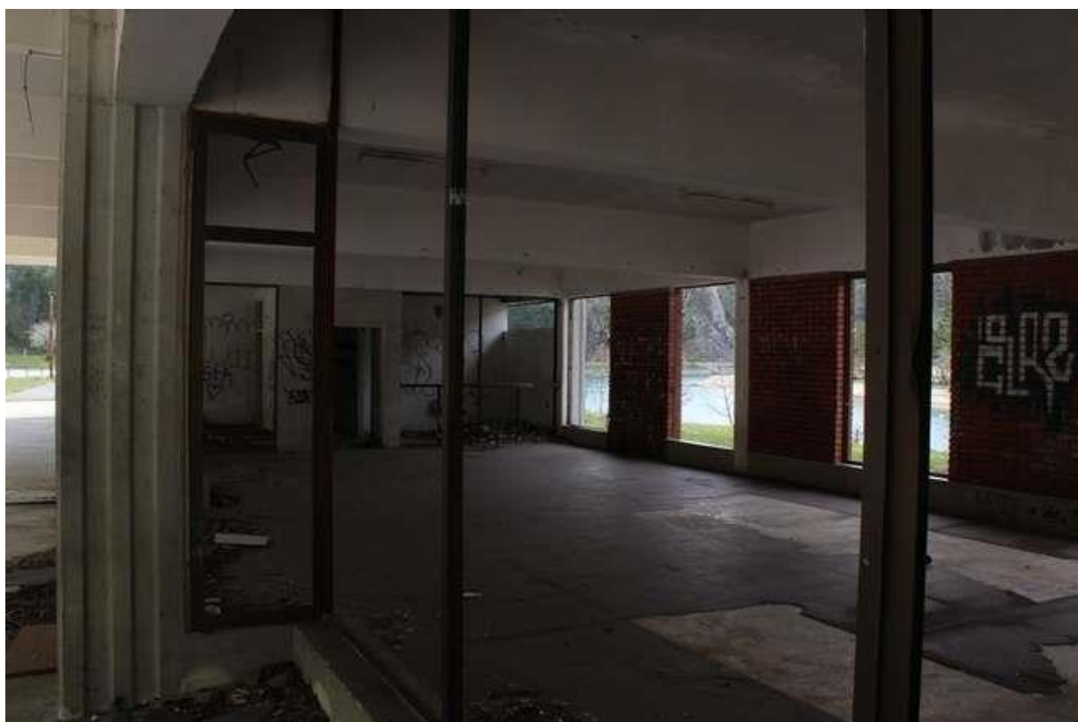
Slika 12: Detalj napuštenog autobusnog kolodvora