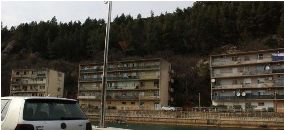
Slika 7: Stare zgrade u Obrovcu