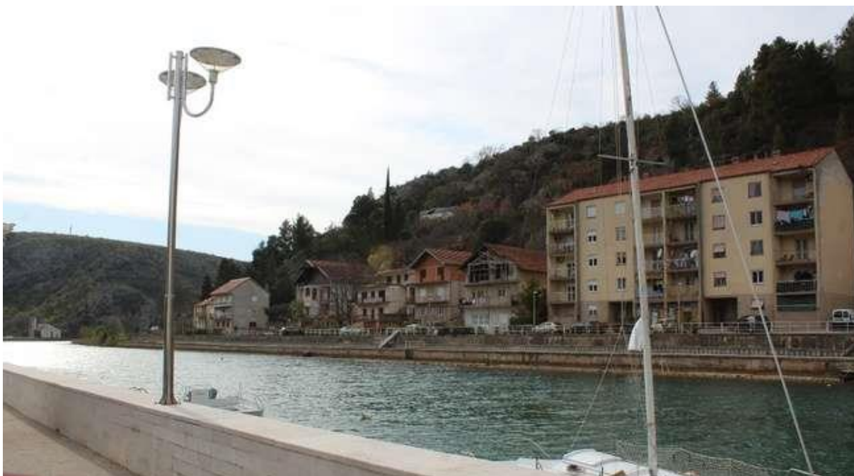
Slika 8: Stare kuće u Obrovcu