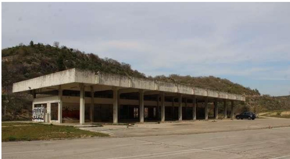
Slika 11: Napušten autobusni kolodvor