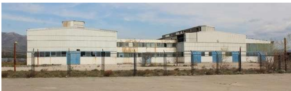
Slika 30: Tvornica Glinice