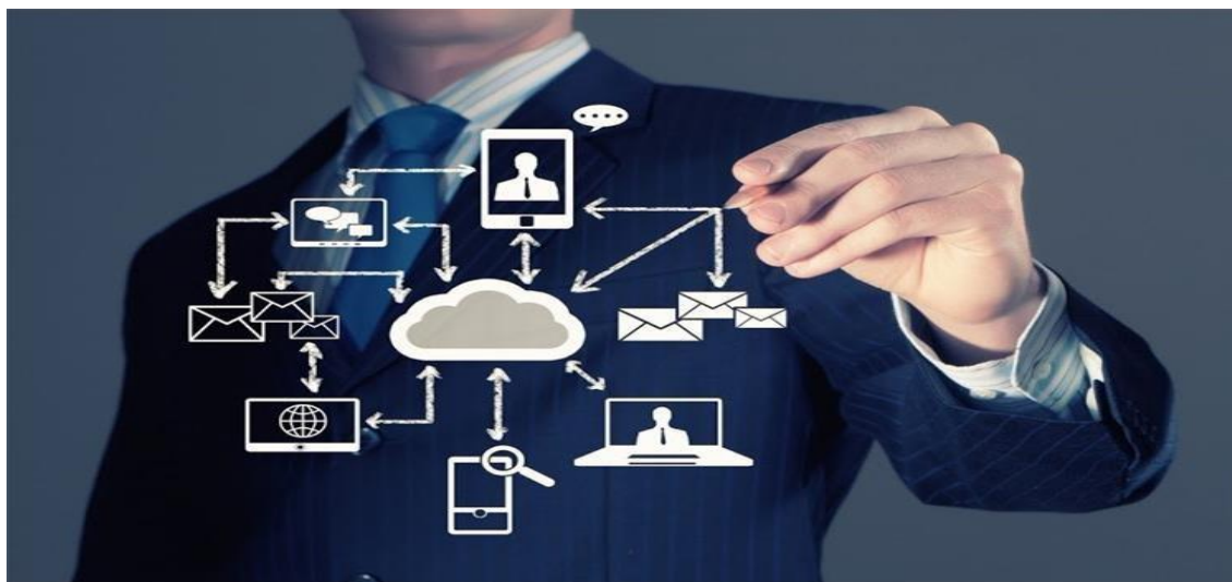
Slika 4. Centralizirani obračun plaća

zahtijevaju njihove sposobnosti. Dodatno, jedan od razloga je pružanje uvida u planiranje mirovina ili potrebe za zapošljavanjem. 23