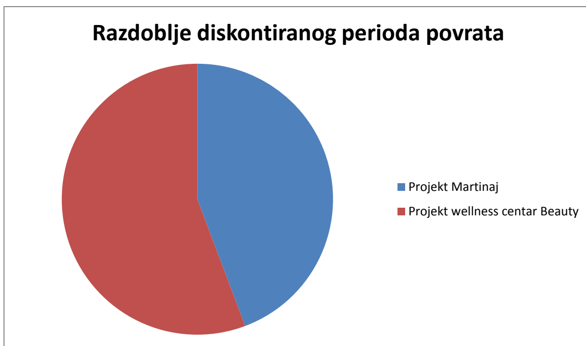
Grafički prikaz 2.