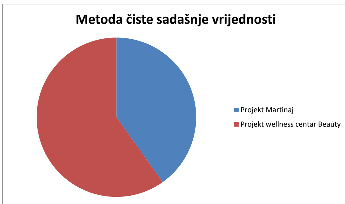
Grafički prikaz 3.