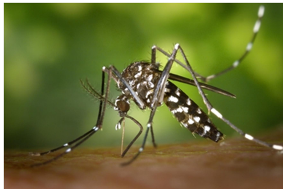
Slika 7. Aedes albopictus Skuse 1894

Jaja najčešće polažu u umjetne bazene, ali i rabljene gume automobila što je dovelo do njihove brze globalne rasprostranjenosti. Imaju kratki domet leta, otprilike 200 metara, zbog čega se nalaze u blizini mjesta izlijevanja, a najčešće su to šume. Budući da su aktivni preko dana, što nije toliko učestalo kod ostalih vrsta, nazivaju se i dnevni šumski komarci. Iako ženke imaju rapidni ubod, uvijek oprezno pristupaju uzimanju krvnog obroka zbog čega je jedan ubod nerijetko dovoljan za razvoj jaja. To rezultira višestrukim ubodima iste ili različite žrtve zbog čega postoji veća šansa prijenosa patogena kao što je primjerice virus Zapadnog Nila (Becker i sur., 2010).