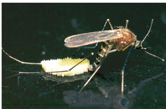
Slika 2. Ovipozicija ženke komarca

Otprilike dva do četiri dana nakon krvnog obroka, ženke polažu između pedeset i petsto jajašaca. Pri polaganju jajašaca ženke stoje na vodenoj površini tako da im stražnje noge zauzimaju V-oblik, a zatim se jajašca ispuštaju kroz genitalni otvor (Barr, 1958). Ovisno o vrsti jaja se polažu u nakupinama ili pojedinačno (Clements, 1992). Za razliku od navedenih, poplavni komarci, kao što su oni iz roda Aedes i Ochlerotatus , jaja ne polažu na vodenu površinu nego na tlo koje će kasnije biti poplavljeno (Slika 2). Supstrat na koji polažu jaja mora biti dovoljno vlažan budući da su ona iznimno osjetljiva na gubitke vode prije nego se formira voštani sloj serozne kutikule. Kako bi se izlegle ličinke naknadno je potrebna određena količina vode (Horsfall i sur., 1973), a poželjno je i da se u blizini nalaze odrasli komarci koji bi štitili ličinke od možebitnih predatora (Clements, 1992). Ovakav način ovipozicije ima prednost nad uobičajenim u razdobljima kada vode na nekom području trenutno nema, ali će je kroz neko vrijeme biti.