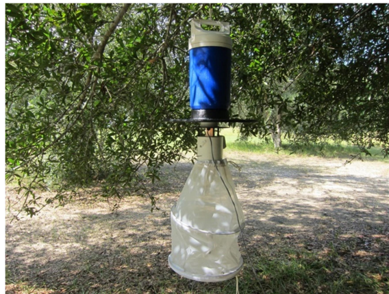
Slika 11. CDC klopka

Još jedan način prikupljanja uzorka odraslih jedinki vrši se pomoću CDC klopke (Slika 12). Sastavljene su od plastičnog poklopca i cilindra, ventilatora i mrežice za sakupljanje uzorka. U mrežicu se stavljaju atraktanti, a najčešće su to svjetlo i suhi led. Iz suhog leda sublimira ugljikov dioksid koji privlači ženke komaraca u potrazi za krvnim obrokom. Klopke je najbolje postaviti blizu vodenih površina koje su zaklonjene od vjetra (Boca i sur., 2004).