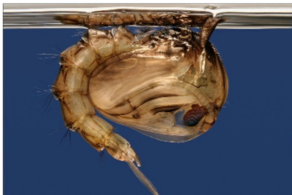
Slika 4. Kukuljica komarca

Stadij kukuljice (Slika 4) je kao i prethodna dva akvatičan, odnosno ona se nalazi blizu površine vode budući da i dalje atmosferski kisik uzima preko sifona. Dužina trajanja ovog stadija ovisi o temperaturi. Pri višim temperaturama smanjuje se razdoblje stadija kukuljice, a pri nižim produžuje. Kukuljica predstavlja prijelazni stadij u kojemu dolazi do određenih morfoloških promjena ličinke na putu ka odraslom komarcu. Najznačajnija promjena je fuzija glave i prsa u tvorbu zvanu cephalothorax , dok zadak ostaje zaseban, zbog čega je tijelo kukuljica dvodijelno, a ne trodijelno kao kod ličinki. Kukuljica komaraca je poprilično pokretna, a nakon zaranjanja uzrokovanog naglim poremećajima površine vode, kukuljica se pasivno vraća na površinu dok je kod ostalih kukuljica kukaca uočeno aktivno plivanje do površine vode. Bitna prilagodba opstanka komaraca je što se odrasle jedinke mogu razviti i iz relativno oštećene kukuljice kao što su one, primjerice, kod isušivanja staništa. Za razliku od stadija ličinke, kukuljica se ne hrani (Becker i sur., 2010).