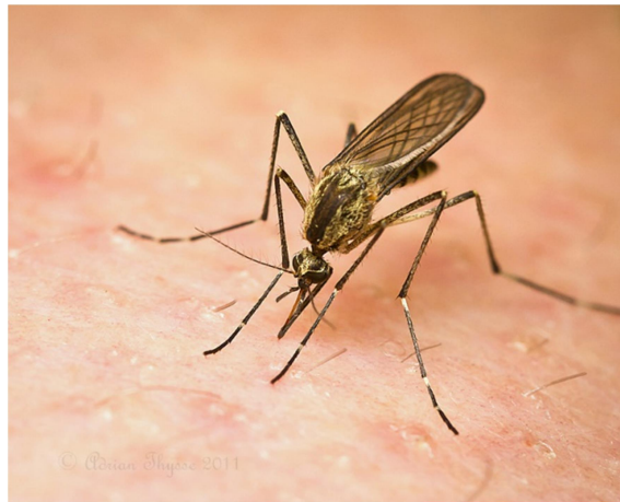
Slika 5. Odrasla ženka roda Aedes

Odrasla jedinka (Slika 5) predstavlja završni stadij metamorfoze komaraca. Kukuljica se postavlja u horizontalni položaj i zatim guta zrak kako bi se povećao pritisak između kutikule kukuljice i odrasle jedinke što dovodi do pucanja kutikule kukuljice duž ekdisalne linije (Mohrig, 1969). Nakon pucanja, odrasla jedinka polako napušta kukuljicu. Mužjaci komaraca kasnije spolno dozrijevaju nego što to čine ženke, zbog čega njihov stadij odrasle jedinke nastupa obično dan do dva prije nego u ženki (Gillett, 1983). Kako bi se to postiglo skraćuje se vrijeme ličinke mužjaka što za posljedicu ima da su odrasli mužjaci pojedine vrste manji nego odrasle ženke iste vrste komaraca.