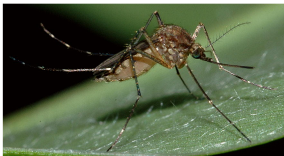
Slika 6. Aedes vexans Meigen 1830