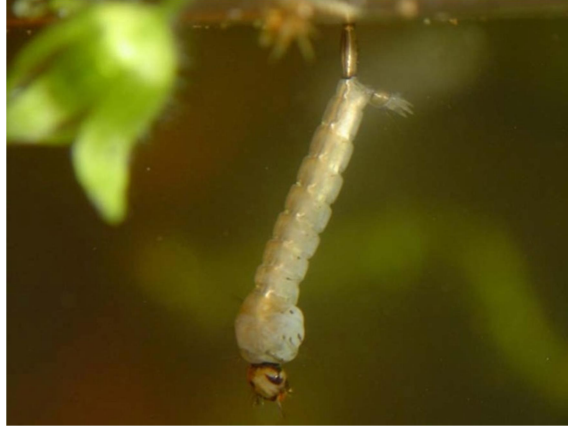
Slika 3. Ličinka komarca