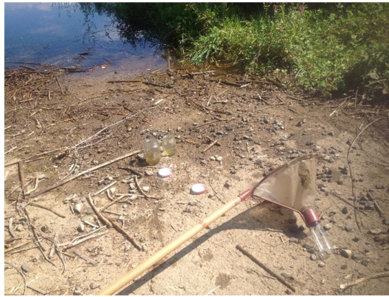
Slika 9. Leglo komaraca i mrežica za ličinke

Na malim vodenim površinama cijeli uzorak profiltrira se kroz mrežicu u staklenu bočicu. Kako je uzorka na ovim leglima malo, kao standard se koristi pola litre uzorka.