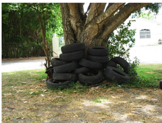
Slika 8. Rabljene gume – malo leglo