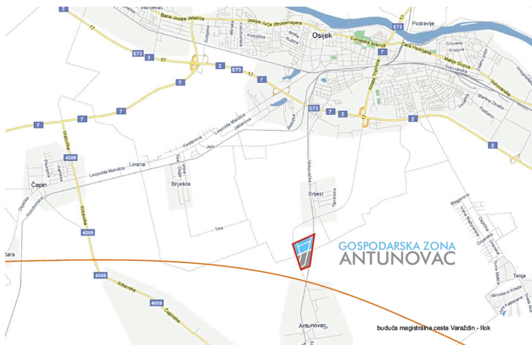
Slika 2. Geografski položaj Gospodarske zone Antunovac

Položaj zone se može bolje vidjeti na Slici 2. i uočiti njezina blizina budućoj magistralnoj cesti Varaždin – Ilok koja će zasigurno u budućnosti biti od velike važnosti za još veću i razvijeniju infrastrukturu.