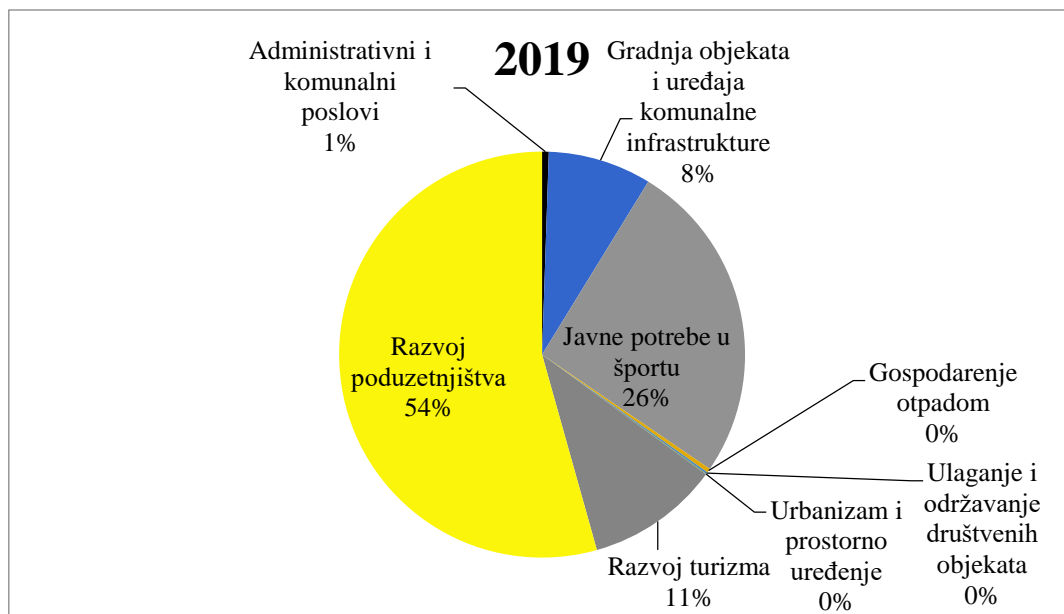
Graf 2. Prikaz omjera iznosa koji su uloženi u razvojne programe općine Antunovac