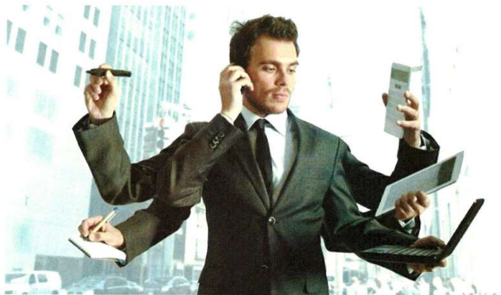
Slika 1.: Menadžer

Sve navedene vještine se stječu obrazovanjem, iskustvom rada i inovacijom znanja. Inovacija razvoja menadžera provodi se u okviru standardnih programa i programa po mjeri. Standardni programi su opće vrijedeći, dok programi po mjeri odnose se na konkretan slučaj. Istraživanja pokazuju da mala poduzeća većinom koriste standardne programe, dok veće kreiraju vlastite programe. 6