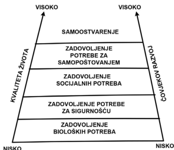
Slika 2 Perspektiva kvalitete života

Izvor: Pastuović, N.: CILJEVI I SVRHA OBRAZOVANJA ODRASLIH U SUVREMENOM DRUŠTVU: Andragoški glasnik: Vol 20, Broj 1-2, 2016., str. 11