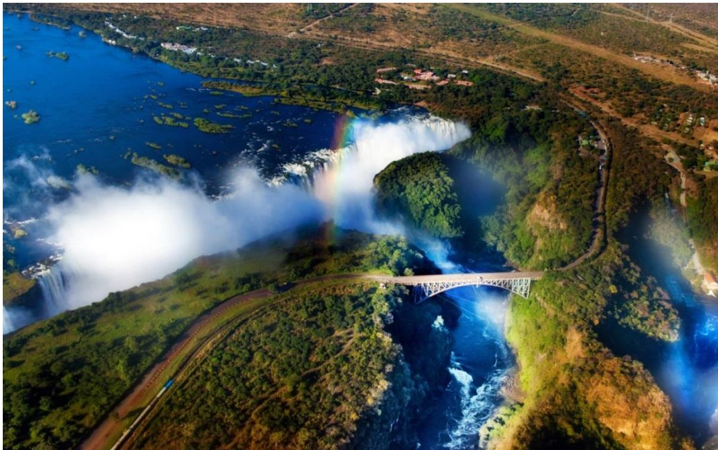
Slika 3: Viktorijini slapovi na rijeci Zimbabve

Najpoznatije destinacije avanturističkog turizma u svijetu svakako su: Viktorijini slapovi na rijeci Zimbabve, južna Afrika, kanjon rijeke Colorado u SAD-u, Alpska područja u Europi, Nepal, Istočna Azija i Pacifik. Od novijih turističkih destinacija koje svoju turističku ponudu baziraju na avanturističkim aktivnostima posebno se ističu otočje Fidži, Cairns u Australiji, Queenstown na Novom Zelandu, Costa Rica te Antartika. Osim navedenih destinacija, u svijetu se pojavljuje sve veći broj destinacija koje ponudu avanturističkih aktivnosti nude kao svoj primarni turistički proizvod ili kao dodatnu atrakciju za povećanje konkurentnosti na globalnom tržištu. Na ovaj način omogućuju turistima dodanu vrijednost i povećavaju cjelokupnu kvalitetu ponuđenih proizvoda.