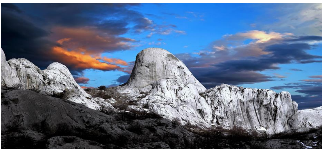
Slika 10: Nacionalni park Paklenica

Područje južnog Velebita, kao brdsko planinsko područje, prepoznatljivo je po kanjonima Velike i Male Paklenice koji su zbog svojih geomorfoloških i ostalih vrijednosti zaštićeni u kategoriji Nacionalnog parka. Ostali dio Velebita nalazi se pod zaštitom u kategoriji Parka prirode. Cijelo područje bogato je brojnim krškim fenomenima oblikovanih pod utjecajem podzemnih voda što ga definitivno čini prijestolnicom avanturističkog turizma Zadarske županije. Najčešće aktivnosti koje se provode su špiljarenje (speleologija), planinarenje i alpinizam, trekking, jeep safari te brdski biciklizam. Najpoznatije i za turistički obilazak prilagođene špilje su Manita peć i Modrić špilja.