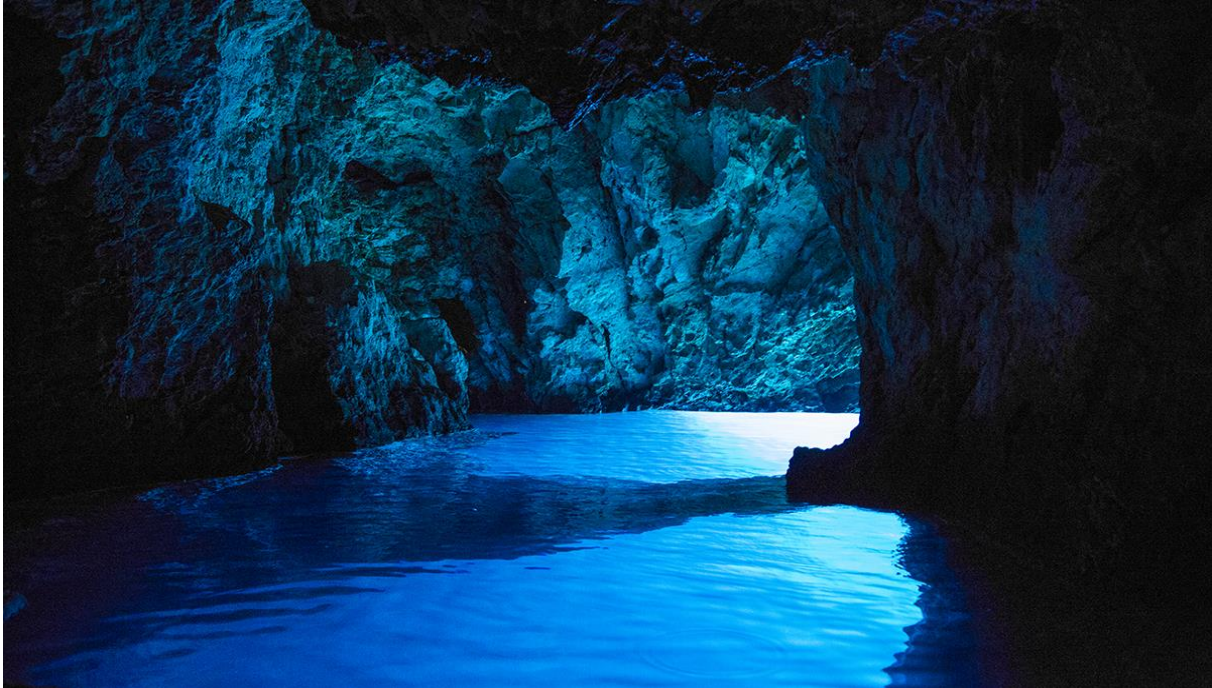
Slika 4: Modra špilja na otoku Biševu

špilje: Baraćeve špilje u Rakovici, špilja Baredine u Novoj Vasi, špilja Biserujka na otoku Krku, Feštinsko kraljevstvo u Feštini-Žminju, hvarska Grapčeva špilja, Lokvarka u Lokvama, Manita peć na Paklenici, Samograd u Perušiću, dugopoljska špilja Vranjača, fužinska špilja Vrelo i već spomenute Veternica, Cerovačke špilje i Modra špilja.