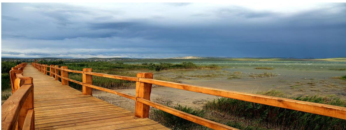
Slika 9: Park prirode i ornitološki rezervat Vransko jezero