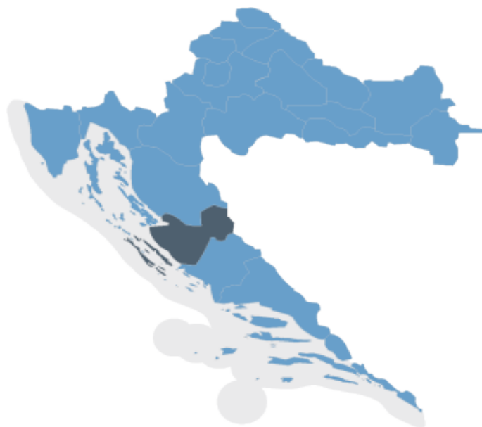
Slika 5: Položaj Zadarske županije na karti Republike Hrvatske

Zadarska županija smještena je u središnjem dijelu hrvatske obale Jadrana i sa svim svojim potencijalima zauzima važnu poziciju na karti hrvatske turističke ponude. Županija se proteže na 7.276,23 km 2 (8,3% ukupne površine Hrvatske), od čega 3.643,33 km 2 otpada na kopneni dio, a 3.632,9 km 2 na morski dio (Prostorni plan Zadarske županije, 2006). Obuhvaća obalu i otoke sjeverne Dalmacije, ravničarsko područje Ravnih kotara, krševito područje Bukovice, dio ličko-krbavskog brdsko-planinskog područja s Pounjem, krševito područje Velebitskog kanala te planinsko područje Velebita kao prirodnu granicu s kontinentalnom Hrvatskom i Likom. Administrativno, županija graniči sa Šibensko-kninskom, Primorsko-goranskom te Ličko-senjskom županijom. Županija u svom sastavu ima 34 jedinice lokalne samouprave, 6 gradova (Zadar, Benkovac, Biogradn/M, Obrovac, Pag i Nin) i 28 općina (Bibinje, Galovac, Gračac, Jasenice, Kali, Kolan, Kukljica, Lišane Ostrovičke, Novigrad, Pakoštane, Pašman, Polača, Poličnik, Posedarje, Poveljana, Preko, Privlaka, Ražanac, Sali, Stankovci, Starigrad, Sukošan, Sveti Filip i Jakov, Škabrnja, Tkon, Vir, Vrsi i Zemunik Donji). Administrativno središte županije je grad Zadar koji je po veličini peti grad u Republici Hrvatskoj i iznimno važno turističko središte.