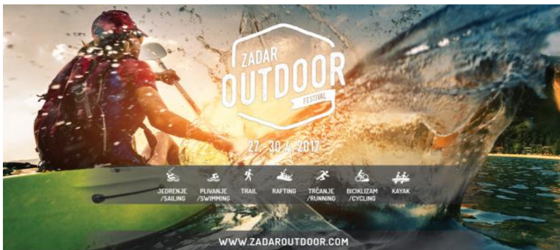
Slika 12: Logo Zadar Outdoor festivala

Od 27.04.2017. do 30.04.2017 na području Zadarske županije održan je prvi Zadar Outdoor festival, zajednički projekt nekoliko vodećih turističkih tvrtki koji je objedinio jedrenje, trail, plivanje, biciklizam, kajakarenje na moru, trčanje i rafting. Tako se područje Zadarske županije na četiri dana pretvorilo u igraonicu avanturizma za profesionalce, rekreativce i amatere raznih profila i interesa.