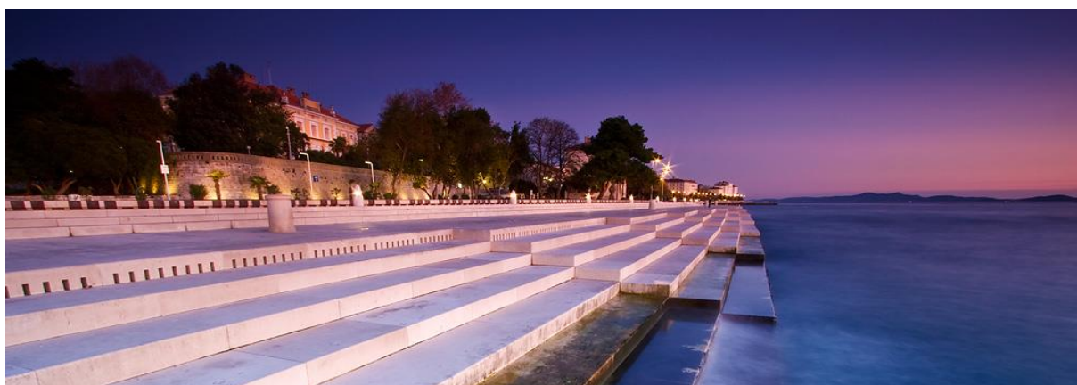
Slika 7: Morske orgulje

Bitno je i naglasiti prepoznatljivi urbanistički izgled grada (rimski raspored ulica – decumanus i cardo) koji uz tradicionalnu obrtničku djelatnost i kulturne ustanove doprinose stvaranju autentičnog kulturnog identiteta grada Zadra ali i cijele županije. Raznolikost manifestacija i priredbi, te novija umjetnička djelatnost i kulturne atrakcije poput Pozdrava Suncu i Morskih orgulja doprinose osuvremenjivanju turističke ponude i stvaranju selektivnih oblika turizma u županiji. Otoci također obiluju pokretnom i nepokretnom kulturno-povijesnom baštinom koja je sačuvana u obliku gradina, crkvi, gospodarskih i tradicionalnih kuća i naselja, suhozida, solana, kula, podmorskih nalaza te svjetionika.