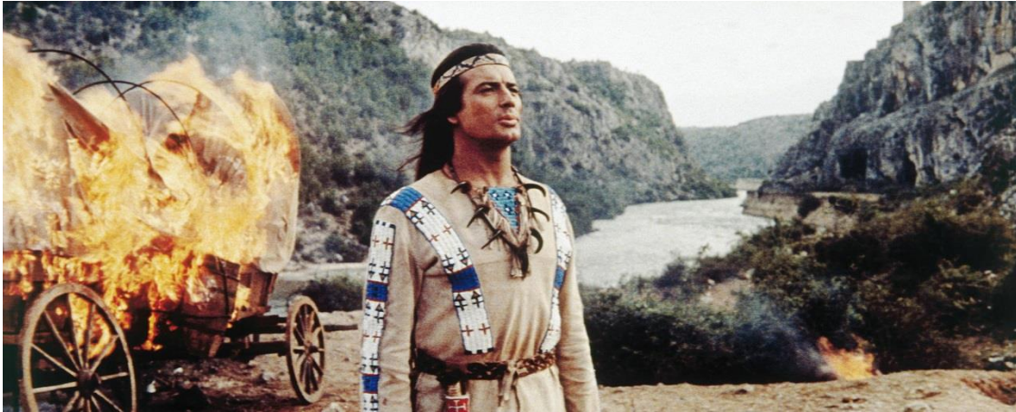
Slika 13: Snimanje filma „Winnetou“ u kanjonu rijeke Zrmanje

kanjona Zrmanje snimao se film o poglavici Winnetou prema knjizi njemačkog pisca Karl May-a, pa se svake godine tradicionalno organizira i manifestacija tragovima Winnetoua koja privlači brojne turiste, posebice iz Njemačke.