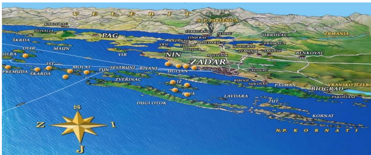
Slika 6: Prirodno okruženje Zadarske županije