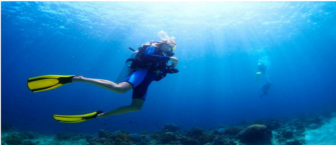
Slika 8: Ronjenje s bocama

Niska i razvedena obala, s brojnim otocima, uvalama i plažama tvore atraktivne krajobraze u Zadarskoj županiji, koji su već prepoznati i turistički valorizirani te se u njima provode brojne turističke aktivnosti. Neosporno je da je more osnovni turistički resurs na kojem se temelji turistička ponuda na ovom području. Obilježja mediteranske klime, razvedenost obale i iznimno pogodni vjetrovi zadarski i biogradski kanal čine vrlo atraktivnim i pogodnim za nautički turizam, i na kojima se već održavaju brojne regate sa međunarodnim sudjelovanjima. Podmorje otoka posebno je bogato ribom te ostalom podmorskom florom i faunom koja čini osnovu za razvoj ronilačkog i ribolovnog turizma.