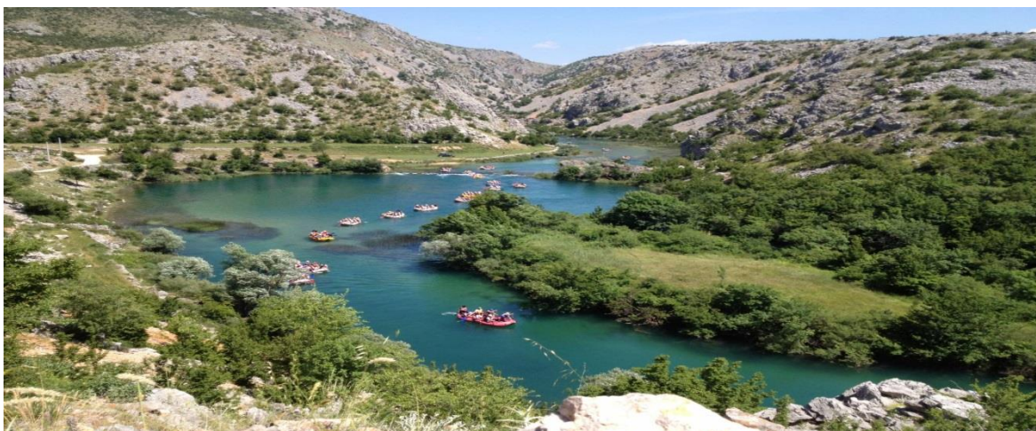
Slika 14: Rafting regata Zrmanja