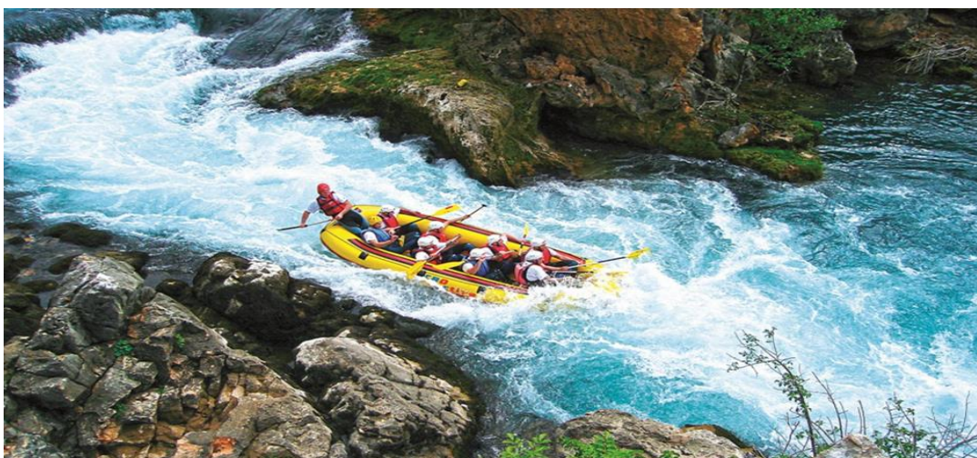
Slika 11: Rafting na rijeci Zrmanji

Kroz krševiti krajobraz Bukovice teče rijeka Zrmanja, najvažnija rijeka za područje cijele Zadarske županije. Njezina posebnost leži u činjenici da je jedina rijeka u Hrvatskoj čija se službena rafting/kajak staza nalazi iznad hidrocentrale. Zbog toga, vodostaj rijeke uvjetovan je isključivo prirodnim čimbenicima. Ako je vodostaj rijeke visok, organiziraju se rafting ture, a ako je nizak kajak ture. Upravo je iz tog razloga rijeka Zrmanja dobila naziv ljepotica i zvijer.