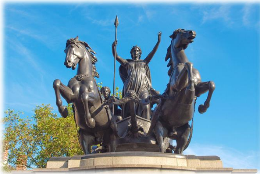
Slika 6. - Kraljica Budika

Iceni su bili pleme u istočnom dijelu Britanije (današnji Norfolk i Suffolk). Nakon invazije Britanije 43. g. Iceni su sklopili savez Rimljanima, te dobili jamstvo kako će njihova zemlja biti zaštićena i pošteđena od uništenja. U narednim godinama i raspoređivanjima po Britaniji, u Colchesteru je ostao izrazito mali garizon vojnika, te je radi straha uslijedilo razoružavanje Ikena. Ovo je posebice zasmetalo keltskim ratnicima, a nakon puča, na vlast dolazi kralj Prasutag. On obnavlja svoj savez s Rimljanima, ali je vodio politiku koja nije bila pro-rimska kao politika svoga prethodnika što je dodatno smetalo Rimljanima. Nakon njegove smrti, Svetonije se pribojavao kako bi Iceni mogli stvarati dodatne probleme, pa je tako odlučio nasilno aneksirati njihove krajeve i uspostaviti svoje administratore kako bi održavali rimski zakon. Ovo je razjarilo Icene, te nakon javnog bičevanja kraljice Budike, koja je jednom prilikom javno kritizirala Rimljane, dolazi do prave pobune. Budika ubrzo postaje simbol otpora, a povjesničar Dion Kasije je kasnije opisuje kao „visoku, strašnu i podarenu snažnim glasom. Njena crvena kosa protezala se do koljena, te je nosila kitnjast zlatni torkves, višebojnu haljinu i raskošan plašt učvršćen brošem. Nosila je dugačko koplje, te izazivala strah u svakome tko ju je pogledao.“ 79