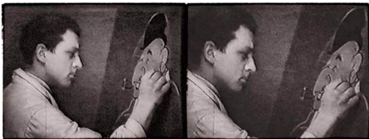
Prilog 2. Isječak iz filma Kako se stvaraju izložbe koji prikazuje ilustratora Waltera Neugebauera 71