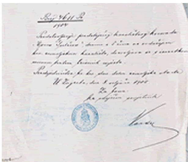
Slika 3. Mišljenje cenzora o rukopisu Evica Gupčeva 56