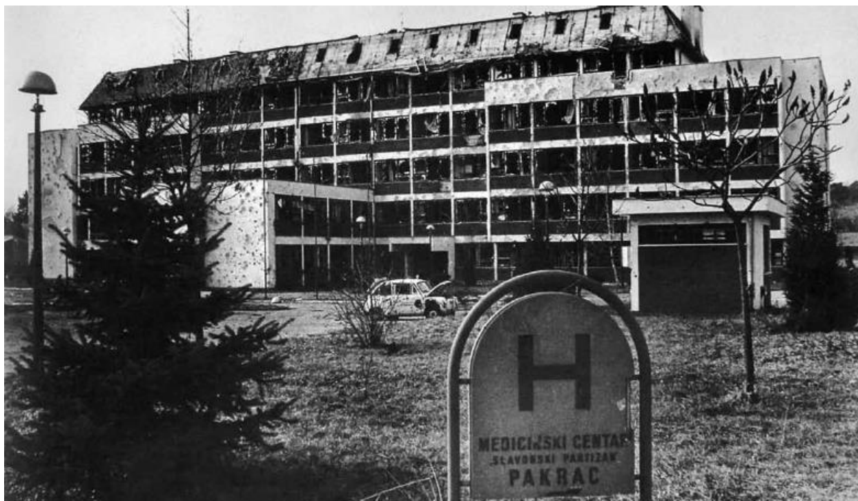
Slika 1. – Uništena pakračka bolnica u zimu 1991./1992. 74