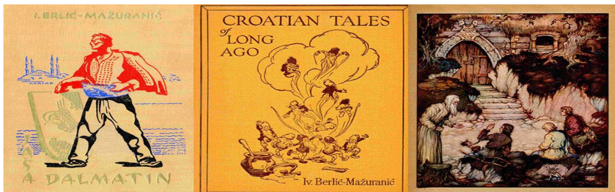
Slika 2. Zavičajna zbirka Brodensia

Vrijednost je ovog digitalnog repozitorija, nastalog konverzijom različitih pisanih, slikovnih i drugih izvornika, što ima mogućnost trajnog nadopunjavanja. Izbor građe posjeduje veliki informacijski potencijal, posebno značajan za prostor Brodskog Posavlja. Upravo je ta građa važna jer je kroz nju moguće osvijetliti povijest i razvoj lokalne zajednice, njezine lokalitete i djelatnosti u vremenskom slijedu od više stotina godina. Digitalizacija ove vrlo informativne građe može biti podloga za izradu virtualne izložbe koja bi pričala priču o Brodu na Savi/Slavonskom Brodu minulih vremena: o poznatim lokacijama, parkovima, arhitekturi, ustanovama, događanjima i značajnim Brođanima. 77 Projekt je vidljiv na stranici