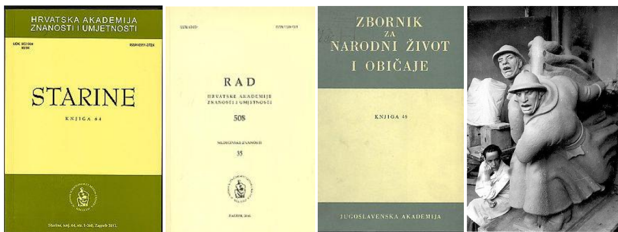
Slika 5. Digitalna zbirka HAZU-a

Kako bi se prikazalo detalje osobito vrijednih digitaliziranih objekata, poput stare knjige i umjetničkih predmeta, koristi se masterView, koncept obrade, prijenosa i prikaza digitaliziranih sadržaja visoke rezolucije. Osim pohrane dokumenata, repozitorij nudi i mogućnost stvaranja osobnih virtualnih fondova, što može poslužiti u radu članovima i istraživačima Akademije, koji mogu na jednom mjestu okupiti vlastitu znanstvenu produkciju. Osim toga, digitaliziranu kulturno-povijesnu baštinu javnosti je moguće prezentirati i putem virtualnih izložbi. DiZbi nudi i mogućnost sustavnog prihvata građe za izdavačku djelatnost HAZU-a, što je prvi korak u razvoju e-knjižarstva i e-izdavaštva.