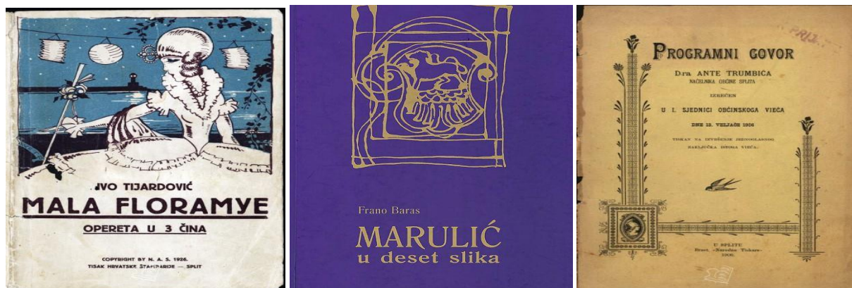
Slika 1. Zavičajna zbirka Spalatina