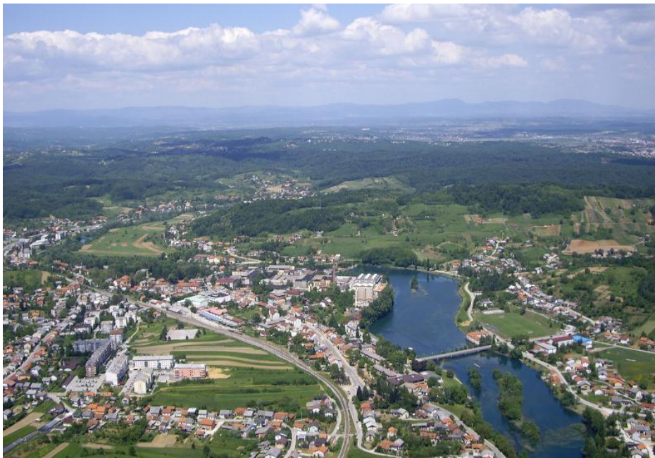
Slika 2: Duga Resa fotografirana iz zraka

Prvi put se Duga Resa spominje 1380. godine, iako ovaj kraj sadrži arheološke nalaze i dokaze naseljenosti još od prapovijesnog doba. Primjerice, lokalitet Sveti Petar Mrežnički važno je arheološko nalazište iz antičkih i rimskih vremena, a dolaskom Hrvata ovo područje postaje važan dio srednjovjekovne hrvatske države, naročito u protuturskim ratovima. U Svetom Petru Mrežničkom bila je osnovana i škola, 1671. godine. Gospodarski razvoj i preobrazba iz sela u suvremeni grad započelo je nakon izgradnje pruge Karlovac – Rijeka 1873. godine te osnivanjem Pamučne industrije 1884. godine, koja je već prije Prvoga svjetskog rata s preko 1000 radnika bila najveća tekstilna tvornica na Balkanu, a po financijskog snazi i veličini u predratnoj Jugoslaviji bila je ubrajana među najveća i najjača poduzeća. (Prus 1984: 7) Općinsko središte postaje 1896. godine, a 1993. godine, nakon uspostave suvremene hrvatske države, konačno dobiva i službeni status grada.