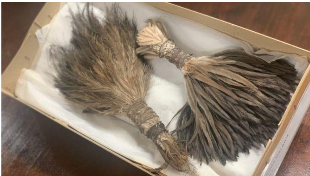
Slika 7. Predmet načinjen od emu perja, a nosio se oko struka kao pojas ili je služio kao ukras na glavi

druge strane, koji drže te predmete, suosjećajni sa zajednicama i ljudima koji te predmete traže nazad. To je jedan od ključnih uvjeta za repatriacijom. Često zapravo proces repatriacije i sam čin repatriacije ovisi o onome tko te predmete i drži, jer ako se netko iz muzeja bori za njihovo vraćanje i ako taj netko ima veliki utjecaj na ostale u muzeju veća je i šansa za željeni ishod, no ako nema nekoga tko je imalo zainteresiran za repatriaciju i za to koji značaj ti predmeti imaju za izvornu zajednicu, teško da će se išta i dogoditi, a predmeti će skupljati prašinu u skladištu, a rijetko će kada biti i prikazani javnosti, barem u slučaju Aboridžina Australije. Mora se razvijati svijest oko važnosti predmeta za izvornu zajednicu, ali i suosjećanje sa ljudima koji su prošli mnogo zala tokom povijesti. Važno je da muzeji komuniciraju sa zajednicama čije predmete drže, da ih se ne odbija čim je zahtjev poslan, te da otvoreno razgovaraju i slušaju što im te zajednice žele reći, a ne samo zauzimati obrambeni stav bez da se sa razumijevanjem sasluša ono što domoroci imaju za reći. Još mogu shvatiti onaj skriveni, sebični razlog zašto muzeji žele zadržati vrijedne artefakte (novac) ali nikako ne mogu razumjeti što muzejima znači držati predmete koji nisu nikada došli na javnu izložbu, već stoje negdje u skladištu, zaboravljeni, ali ne i od domorodačkih zajednica. Nadam se da će ovakvi primjeri, kao što je Manchester muzej, u budućnosti biti sve češći.