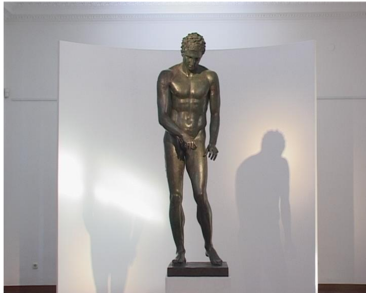
Slika 10. Hrvatski Apoksiomen

antička kuhinja, antički kulturni putovi. Gradonačelnik smatra kako je borba za povratak Apoksiomena na Lošinj doprinos sustavnom usmjeravanju Lošinja ka važnom položaju u hrvatskom kulturnom turizmu. 59 Zanimljivo je i što se sve jednom atrakcijom može osmisliti. Tako je osmišljena ponuda na temu Apoksiomena i antike s namjerom upoznavanja s kulturnom baštinom i antičkim naslijeđima Hrvatske i otoka Lošinja. Održavaju se brojne edukacije, događanja, radionice, i sve je na temu Apoksiomena i antike. 60