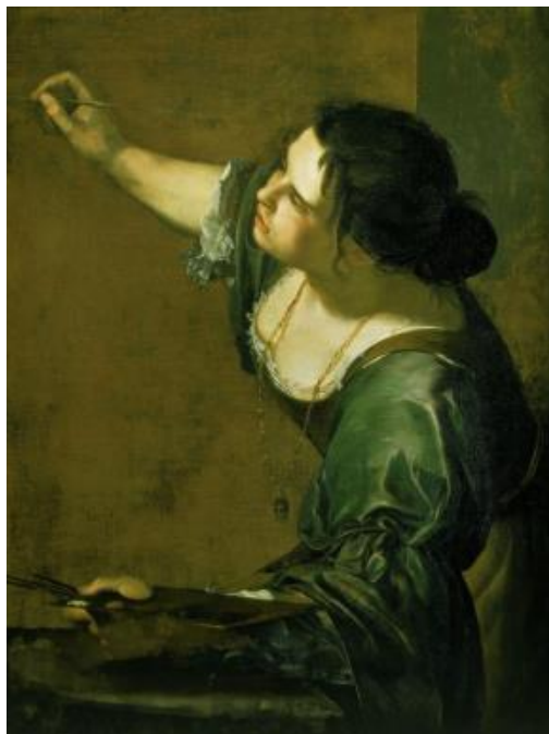
Slika 10. Artemisia Gentileschi, Autoportret kao alegorija slikarstva, 1639., 96.5 x 73.7 cm, Royal collection, London