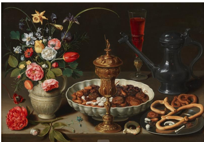
Slika 11. Clara Peeters, Mrtva priroda s cvijećem, kaležom, sušenim voćem, slatkim proizvodima, vinom i vrčem, 1611., 52 x 73 cm, Museo del Prado, Madrid

U razdoblju 17. stoljeća na području sjeverne Europe za žene umjetnice nije bilo uobičajeno slikanje autoportreta. Peeters pronalazi način kako će označiti da djelo pripada njoj, a samim time se istaknuti u društvu, odnosno stvoriti javnu osobu. Slučaj Clare Peeters karakterističan je u tome što je sudjelovala u kreiranju normi slikanja i ikonografije koja će se pojavljivati na slikama mrtve prirode. Tu je vidljiva i njezina želja za emancipacijom koja vodi stvaralaštvo u smjeru inovacija i primjene istih. Istome svjedoči i prikazivanje autoportreta kao dijela mrtve prirode što ukazuje kako koristi sliku kao medij kojim će se promovirati u društvu.