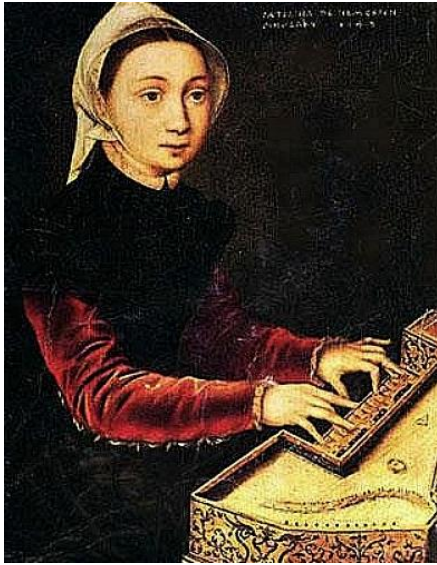
Slika 4. Caterina van Hemessen, Djevojka svira virginal, 1548., 30.5 x 24 cm, Wallraf-Richartz-Museum

naznake prostora, osim u autoportretu i portretu sestre. Djevojka svira virginal (vidi Slika 4 ) portret je na kojem je prikazala svoju sestru kako svira.