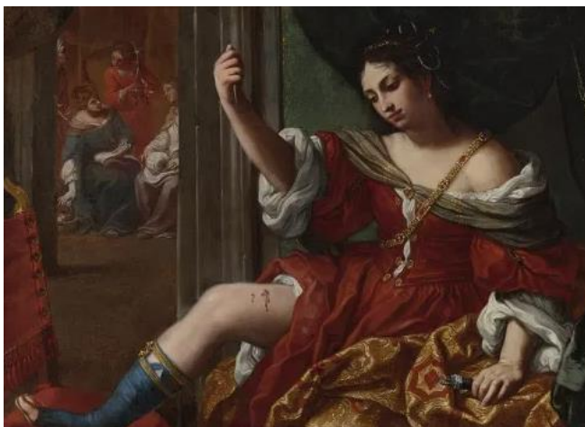
Slika 16. Elisabetta Sirani, Porcia , 1664., 101 x 138 cm, privatna kolekcija

Društvu koje žene prikazuje kao inferiorni spol dokazuje kako umjetnost temelji na znanju koje je stekla čitajući, stoga se u njezinom opusu razaznaju prikazi povijesnih heroína. Prema tome, inspirirana Shakespeareovom dramom Julije Cezar , Sirani slika Portiu (vidi Slika 16 ) na kojoj prikazuje Portiu koja se simbolički ranjava u obrani od Rimskog Carstva. 45