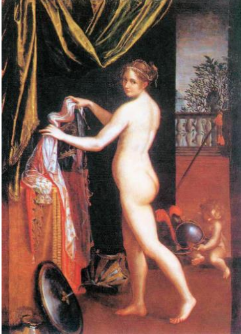
Slika 8. Lavinia Fontana, Minerva se oblači , 1613., Galerija Borghese, Rim

Zaključuje se kako je društvo ipak prepoznalo koliko je Lavinia vješta u prikazu tijela, stoga su pretpostavili da isto nije moglo biti učinjeno bez prethodnog promatranja nage žene zanemarujući činjenicu kako je ona sama upravo žena.