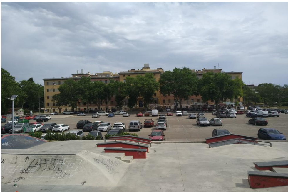
Slika 10. Skate park, parking i zgrada Društvenog centra Rojc, Fotografirala autorica, 2020.

zapuštene prostore na način koji će biti od koristi građanima, interes saveza udruga i udruga usmjeren je prema osiguravanju adekvatnih prostora za upotrebu i stabilnih uvjeta za realizaciju njihovih programa, a interes građana bi trebao biti zadovoljavanje svojih kulturnih, umjetničkih i društvenih potreba“. Tako je u slučaju Rojca, Grad Pula dao prostorni resurs i sredstva za upravljanje i gospodarenje prostorom, a Savez udruga će brinuti o održavanju zgrade, uspostavljanju izravnog kontakta sa zajednicom, koordinirati korištenje prostora i opreme i primjenjivati kriterije za dodjelu prostora. Uključivanjem korisnika u upravljanje osigurat će se veća razina angažmana te će zbog 'osjećaja vlasništva' odgovornije postupati s prostorom. S druge strane, smanjit će se operativni pritisak na gradsku upravu. Strateško upravljanje omogućit će stabilan razvoj i raznoliko financiranje kao naprimjer: „moći će se učinkovito organizirati uslužne djelatnosti kojima će se smanjiti troškovi programa i omogućiti dodatni prihodi za održavanje“ (Boljunčić Gracin et.al, 2016, 45). Projekt „Otvorena platforma Rojc“ bitno će doprinijeti prepoznatljivosti grada. Pula će tako institucionalizacijom partnerstva s civilnim sektorom biti prepoznata kao jedan od rijetkih gradova koji radi na osnaživanju intersektorske suradnje. Društveni centar Rojc imat će prepoznatljiv identitet kao mjesto okupljanja civilnih udruga koje promoviraju europske principe i vrijednosti.