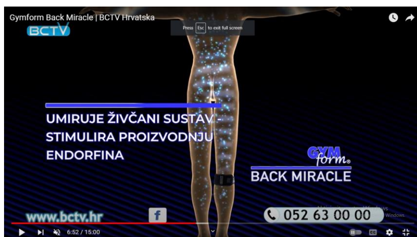
Slika 10. Isječak iz reklame za Gymform Back Miracle

U ovoj se reklami naglasak na pozitivnim, točnije čudesnim učincima proizvoda na zdravlje, što potvrđuju svjedočanstva osoba koje su proizvod upotrebljavale. Dokaz je njegove znanstvene potvrde jednostavan slikovni prikaz, u kojem se tek navodi krajnji učinak uporabe proizvoda, te svjedočanstvo stručnjaka koji jamči njegovu medicinsku dobrobit. Kvazinantveni prikaz načina djelovanja navedenog proizvoda manipulacijska je strategija kojom se utječe na ciljnu publiku, osobe mahom starije životne dobi koje imaju bolove.