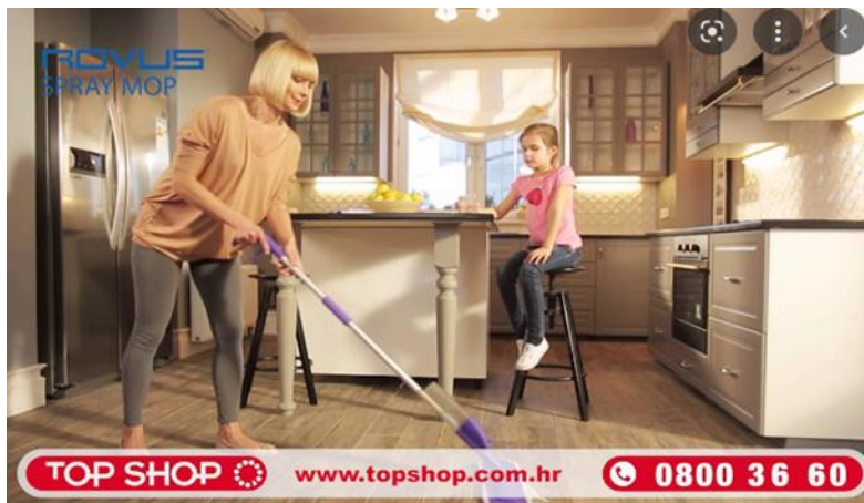
Slika 2. Primjer reklame sa strategijom demonstracije uporabe proizvoda 5

Dakle, od samih je početaka do naših dana došlo do promjena što se tiče pisanja i osmišljavanja televizijskih reklama. Kao što je već spomenuto, danas se u reklamama najčešće koriste svjedočanstvo i demonstracija jer je potencijalnom kupcu važno čuti nečije mišljenje i preporuku za određeni proizvod te je važno vidjeti kako se određenim proizvodom rukuje ili kako ga se upotrebljava. Zapravo obje strategije, i svjedočanstvo i demonstracija uporabe proizvoda, služe povezivanju proizvoda s ciljnom skupinom prema nekim vizualnim obilježjima, primjerice izgled, stil života i sl.