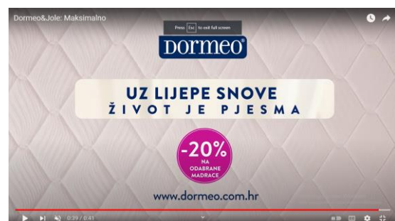
Slika 8. i 9. Isječci iz reklame za Dormeo.