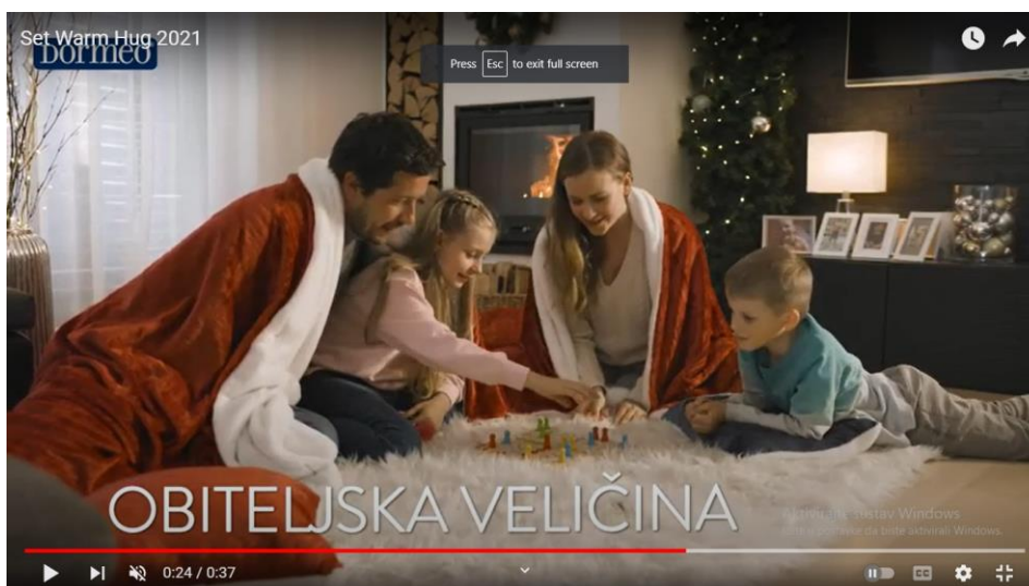
Slika 7. Isječak iz televizijske reklame za Set Warm Hug 2021

U ovoj je reklami proizvod povezan s idealnom obitelji, odnosno toplinom i uživanjem u obiteljskom domu. Izbor riječi kojima se opisuje proizvod može se povezati sa životom idealne obitelji, a mnogi su atributi semantički prazni, odnosno u navedenim sintagmama ne nose dodatno značenje kojim bi se proizvod jasnije opisao.