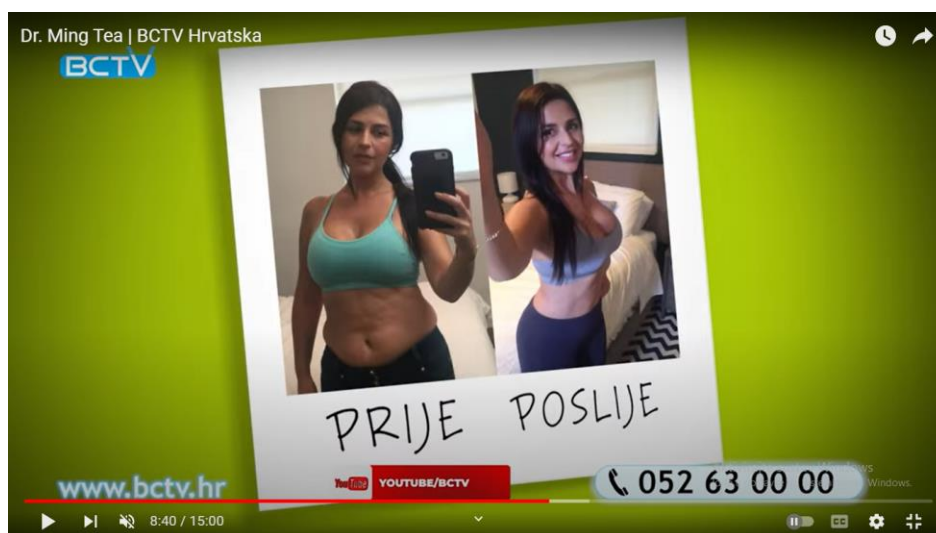
Slika 11. Isječak iz reklame za Dr. Ming Tea

znači da ćemo biti manje gladni te ćemo manje jesti, te će rezultati doći brzo i smršavjet ćemo bez puno truda. Dakle, nema vježbanja i dijeta, što nekome tko želi smršavjeti zvuči jako primamljivo. Tako jedna od sugovornica navodi da joj se nakon konzumacije čaja težina skoro kao da se počela topiti , što potvrđuje da sve ide vrlo brzo i jednostavno. Sugerira se da je potrebno samo popiti šalicu čaja, a to zaista nije teško u usporedbi s vježbanjem i napornim dijetama. Sve to potvrđuje nekoliko sugovornika uz njihove fotografije prije gdje se vidi da su sada vidno mršaviji, a to je sve dokaz koliko ima zadovoljnih korisnika. Također, navodi se da je riječ o prirodnom načinu mršavljenja, što je isto važno jer se naglašava da se ne radi o nečemu djelotvornom, ali dugoročno štetnom proizvodu, nego o nevjerojatnom potpuno prirodnom proizvodu.