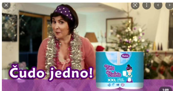
Slika 1. Primjer reklame sa strategijom svjedočanstva 4

proizvod na temelju vlastitog pozitivnog iskustva, odnosno njegova pozitivnog učinka. Preporuku često daje neka poznata osoba. Naravno, korisno svjedočanstvo može dati i netko koga publika uopće ne poznaje, ali mora imati obilježja ciljne skupine kojoj je proizvod namijenjen. Primjerice, domaćica može dati uvjerljivu potvrdu za neki kućanski aparat ili neki predmet u općoj upotrebi u domaćinstvu. Za reklamu sa svjedočenjem najbolje je da sadrži demonstraciju proizvoda u upotrebi (Agnew, O'Brien 1965: 221-223).