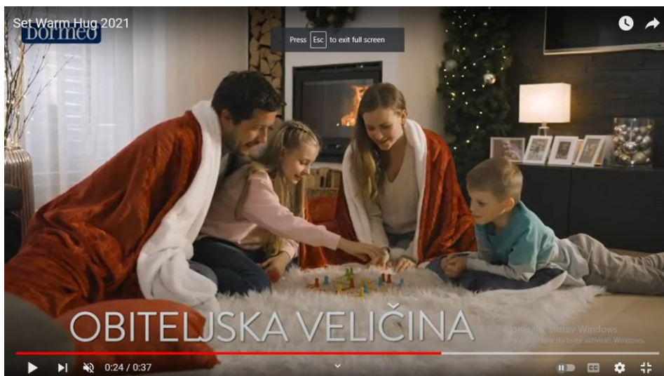
Slika 7. Isječak iz televizijske reklame za Set Warm Hug 2021

U ovoj je reklami proizvod povezan s idealnom obitelji, odnosno toplinom i uživanjem u obiteljskom domu. Izbor riječi kojima se opisuje proizvod može se povezati sa životom idealne obitelji, a mnogi su atributi semantički prazni, odnosno u navedenim sintagmama ne nose dodatno značenje kojim bi se proizvod jasnije opisao.