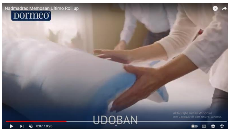
Slika 5. Isječak iz televizijske reklame za nadmadrac Memosan Ultimo Roll up

U reklami je u prvom planu praktičnost i funkcionalnost samoga proizvoda, koja se povezuje sa životnim stilom mladih ljudi.