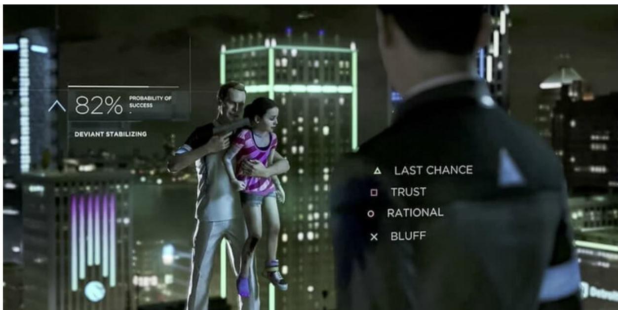
Slika 9 Schreenshot Detroit: Become Human