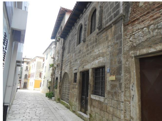
Slika 9: Kuća dva sveca izgrađena u 15. stoljeću

Nakon Drugog svjetskog rata u kući se kratko vrijeme nalazio lapidarij, no on je ubrzo premješten u glavni muzej, odnosno palaču Sinčić. Žalosno je to što kuća trenutno izgleda veoma oronulo i neodržavano iznutra, jer se konkretno kroz prozor vide nabacane stvari po prostoriji. Povezano sa stanjem, još je čudnije upravo to što je na kući postavljena ploča