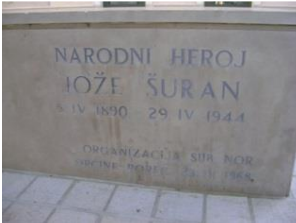
Slika 13: Spomenik Jože Šurana u Višnjanu

se može rekonstruirati ukoliko „pamćenje također djeluje rekonstrukcijski. Prošlost se neprestano reorganizira kroz promjenjivi relacijski okvir sadašnjosti što se kreće unaprijed.“ 71 U tom smislu, simbolika i značaj kipa Joakima Rakova u doba Jugoslavije je nešto sasvim drugo od onog što on predstavlja danas.