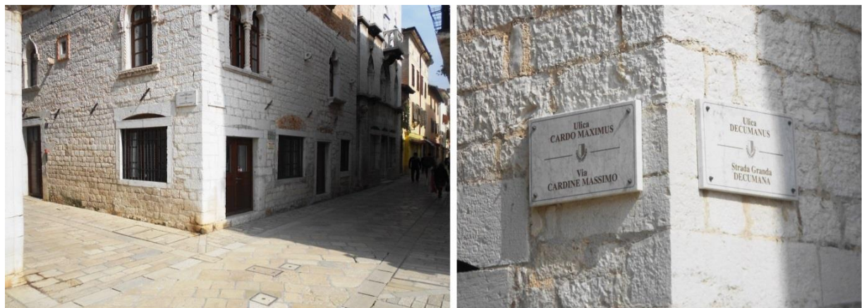
Slika 2: Mjesto gdje se ulice Decumanus i Cardio Maximus presjecaju

i okomite sektore grada. Središnja ulica bila je namijenjena spajanju početka i kraja poluotoka na kojem je bilo svetište, a presjeca je Cardio Maximus u smjeru sjever-jug.