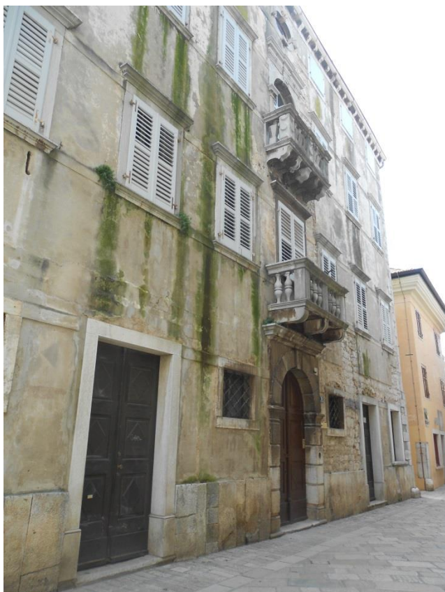
Slika 11: Palača Sinčić – Zavičajni muzej Poreštine

razgledavaju jer nisu zabačene. Ovdje se cijela problematika usmjerava naravno na ekonomsku vrijednost kulturne baštine. Kulturna baština koja pridonosi boljem ekonomskom stanju u Poreču uvijek je više mamila pažnju upravi grada, dok se ostala zanemarivala. Iako je Kuća dva sveca poznato kulturno dobro Poreča, nije na prometnom mjestu i tu se javlja problem koji se jasno uviđa. Kulturna i ekonomska vrijednost kulturne baštine trebale bi se ispreplitati i nadopunjavati, a ne isključivati kao u ovom slučaju.