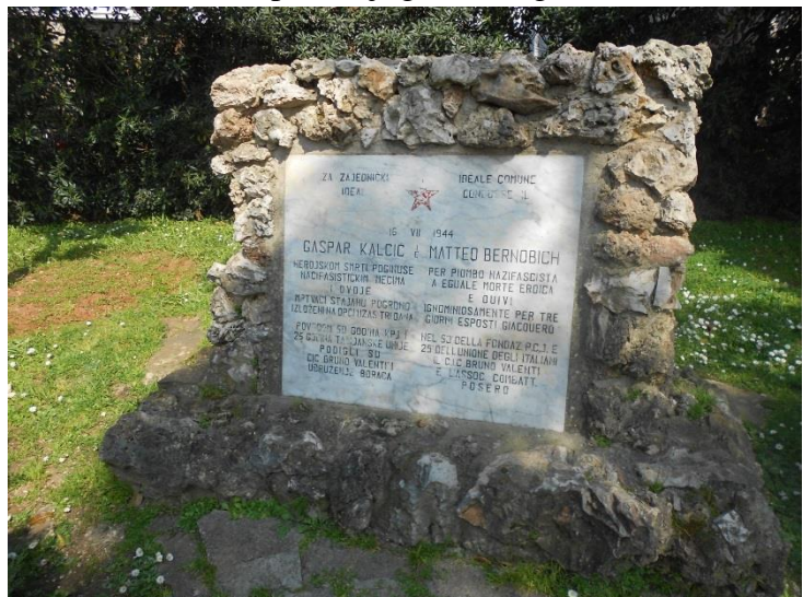
Slika 16: Spomenik istaknutim antifašističkim borcima – Gašpar Kalčić i Mateo Bernobić

Komemoracija antifašističkih boraca u toponimiji Poreča najviše se vidi u nazivu ulica, zatim na primjeru jednog trga, obale i parka.