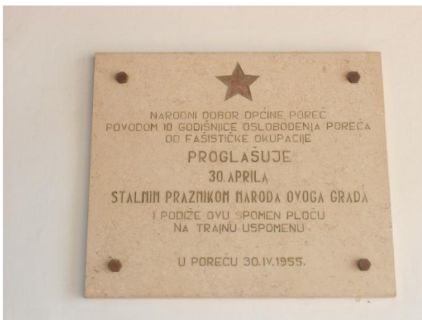
Slika 20: Ploča postavljena na zgradi Općine Poreč

sjećanje na dan kada se grad oslobodio od okupatora te brojna kulturna događanja, održava se sjednica Gradskog vijeća i obilaze se komemorativna mjesta koja utvrđuju sjećanja na ratna događanja. Ceremonijalno se polažu brojni vijenci pored antifašističke materijalne baštine i time se simbolizira velik značaj antifašističkog pokreta za grad. Ovim sjećanjima se potvrđuje svjesnost o prošlosti i utvrđuje pozicija s koje se gleda na nju. Primjer se može naći u govoru koji je održao gradonačelnik Poreča, Edi Štifanić, na ovogodišnjoj obljetnici oslobođenja od okupatora. On ističe: „ Način na koji mi slavimo Dan oslobođenja Grada Poreča, dostojanstveno, s ponosom i zahvalnošću jednako tako pokazuje kakav je Poreč grad. Grad koji se ne srami antifašizma. Poreč prepoznaje vrijednosti koje smo dobili narodnooslobodilačkom borbom i žrtvom boraca u Drugom svjetskom ratu. I naravno, ne treba izjednačavati antifašizam i komunizam, ali to ne znači da smijemo negirati antifašizam koji je u temeljima ovoga grada. “ 127 Ovom izjavom se samo potvrđuje ono što je i vidljivo u gradu, a to je da su temeljna usmjerenja kulturne politike Poreča već odavno utvrđena i nadalje se mogu samo nadograđivati.