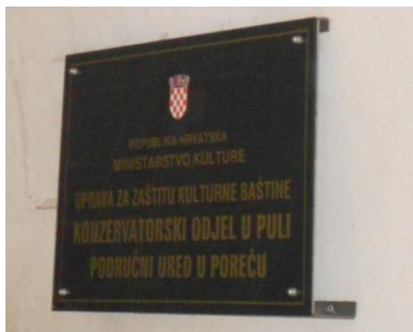
Slika 10: Ploča u lučnom ulazu Kuće dva sveca

Ministarstva kulture Republike Hrvatske, a sama se kuća, kao što je naglasila Elena Uljančić Vekić, nalazi u vlasništvu Zavičajnog muzeja Poreštine. Kulturna politika koja je u svakom slučaju prvenstveno usmjerena prema očuvanju i zaštiti kulturne baštine, ovaj put je malo zakazala.