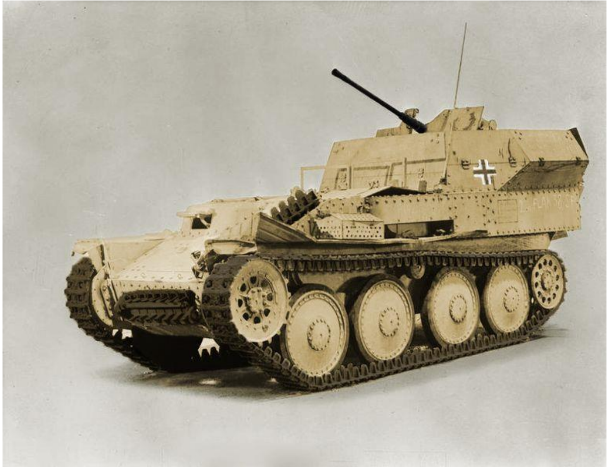
Slika 13.: Samovozni protuavionski top na šasiji Panzera 38 (t)-Flakpanzer. 38 Od 140 vozila koja su proizvedena 1944. godine gotovo svi primjerci uništeni su u borbama na zapadnom bojištu iste godine. 39