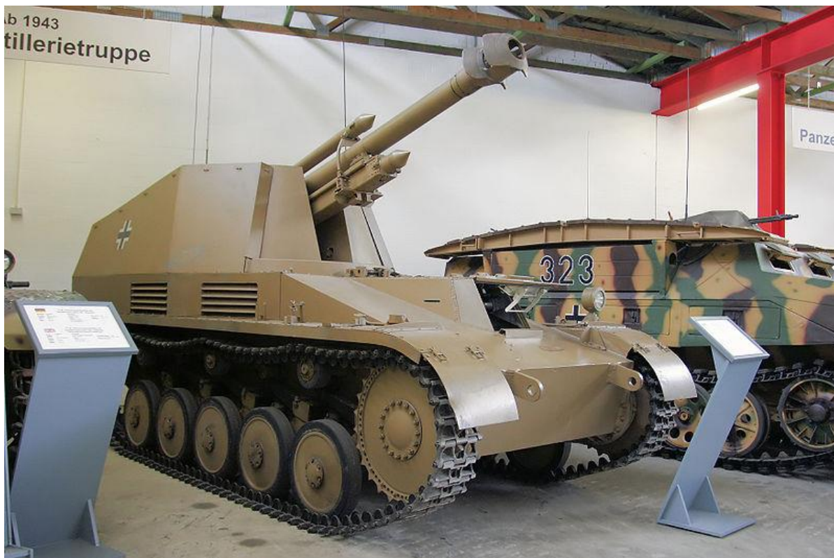
Slika 5.: Wespa , samohodna haubica na šasijsi Panzera II. Krajem 1942. godine započela je proizvodnja toga borbenog vozila kako bi oklopne formacije i pješništvo dobili indirektnu vatrenu potporu. Velik broj Wespi djelovao je na istočnom bojištu, a manji broj korišten je prilikom ofenzive u Ardenima u zimi 1944./1945. godine. 17