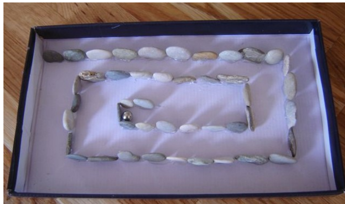
Slika 5. Labirint za istraživanje magnetizma

pojedinačnih, katkad egocentrično prepoznatih manipulativnih istraživanja, s mogućnošću slučajnih otkrivanja“ (Došen-Dobud, 2016: 268). Starija djeca razvrstavaju materijale na temelju kriterija privlačenja i ne privlačenja te na temelju odbijanja ili neodbijanja u određenim uvjetima. U svrhu dokumentiranja procesa i aktivnosti istraživanja moguće je izraditi plakat za bilježenje materijala koje magnet privlači i koje ne privlači. Nadalje, moguće je kao poticaj za istraživanje magneta i magnetizma izraditi labirint od kartonske ploče ili kutije. Djeca će metalnu lopticu voditi do cilja uz pomoć magneta s donje strane ploče.