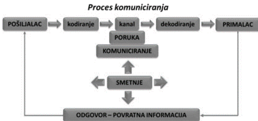
Slika 1. Proces komuniciranja