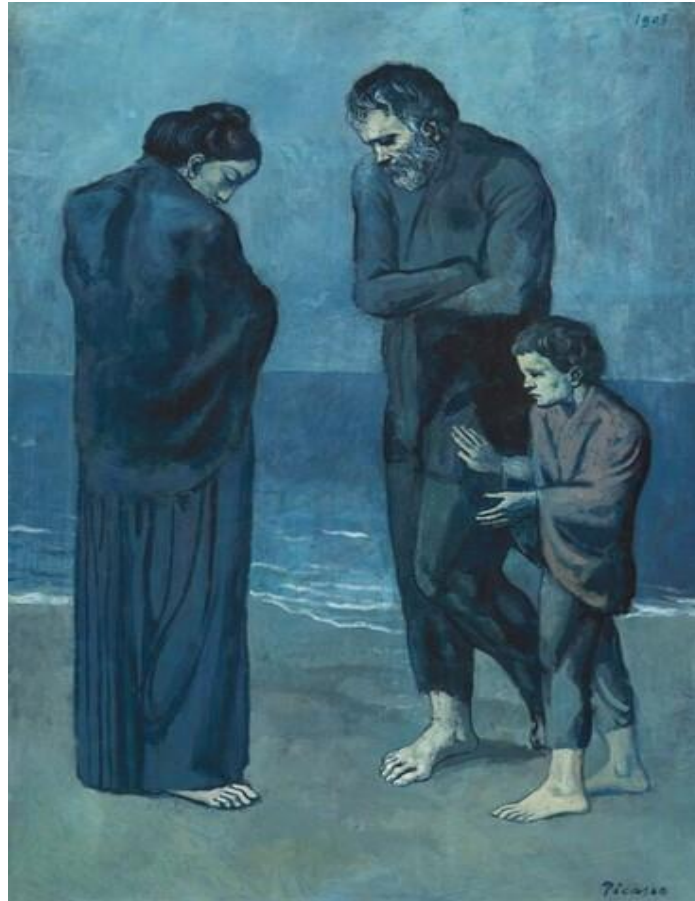
Slika 1. Tragedija Pabla Picassa

Izvor: 3. Pablo Picasso, The Tragedy , https://www.pablocicasso.net/tragedy/#google_vignette (pristupljeno: 14. kolovoza 2023.)