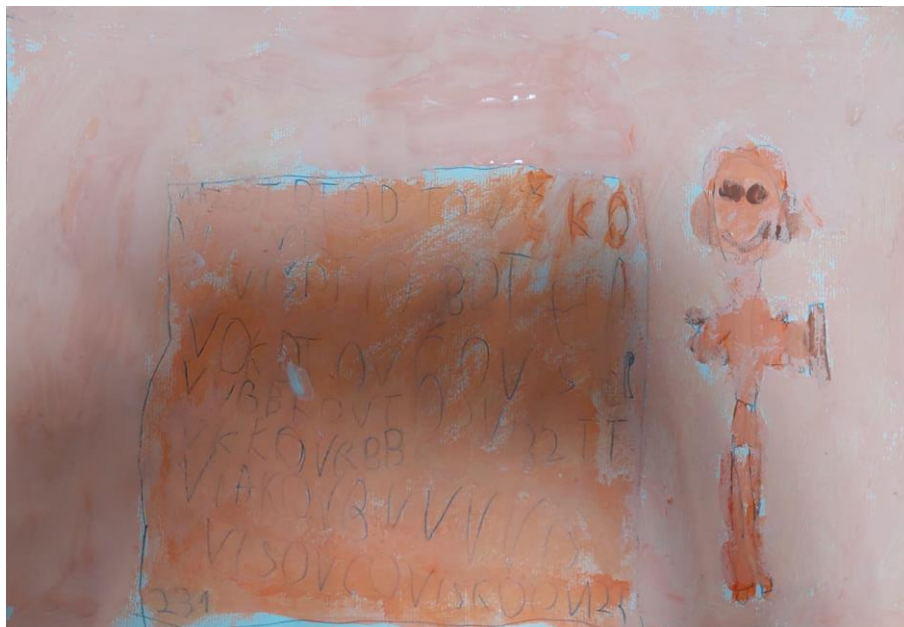
Slika 2. Rad petogodišnjeg dječaka Lovre: „Ja čitam i brat sluša na slušalicama.“

U nastavku su prezentirani i analizirani dječji slikarski radovi prema principu egzemplarnosti. Treba napomenuti da određeni radovi nisu dovršeni jer se aktivnost morala nastaviti drugi dan u predškolskoj ustanovi, pri čemu su tog sljedećeg dana kada se aktivnost nastavila neka djeca izostala. Stoga ti radovi nisu uvršteni u analizu.