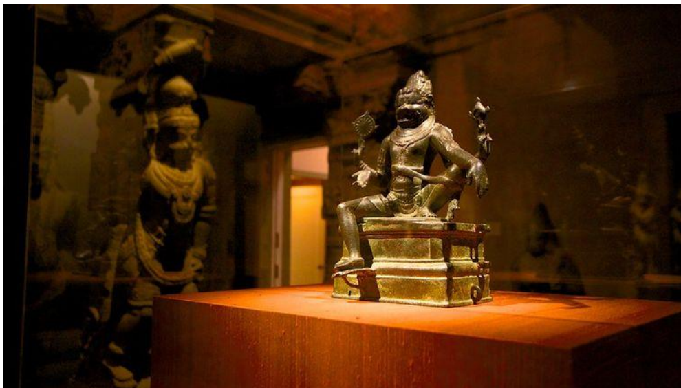
Slika 5. Philadelphia Art Museum : ponekad nam posjet muzeju može nalikovati posjetu hramu