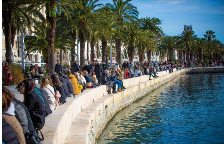
Sl. 5. Split riva 30. siječanj 2021. godine

na taj prostor kao objekt rekonstrukcije i na identitet i vezanost građana koji su tom prostoru davali prvobitno značenje. Drugim riječima, vizualno gubljenje „starog“ izgleda rive je donekle značilo i osjećaja gubljenja povezanosti s osjećajima vezanosti za taj prostor koji su se gradili tijekom stoljeća. Ipak, s vremenom se i „nova“ splitska riva uklopila u kulturnu memoriju i identitet grada zajedno s iskustvom i sjećanjima vezanosti sa starom rivom, te se i danas građani okupljaju na prostoru rive, bilo u kavanama, zbog šetnje ili bivanja u parkovnom dijelu uz more.