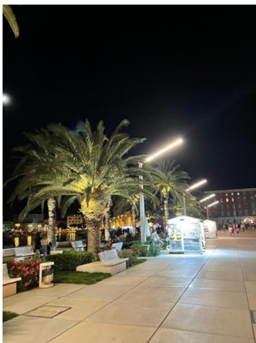
Sl. 16. Riva (zeleni dio uz more), 25. 7. 2019.