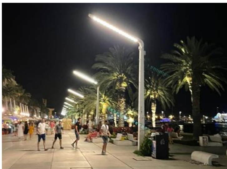
Sl. 18 Riva (zapadni vrh šetnice), 26. 7. 2019.