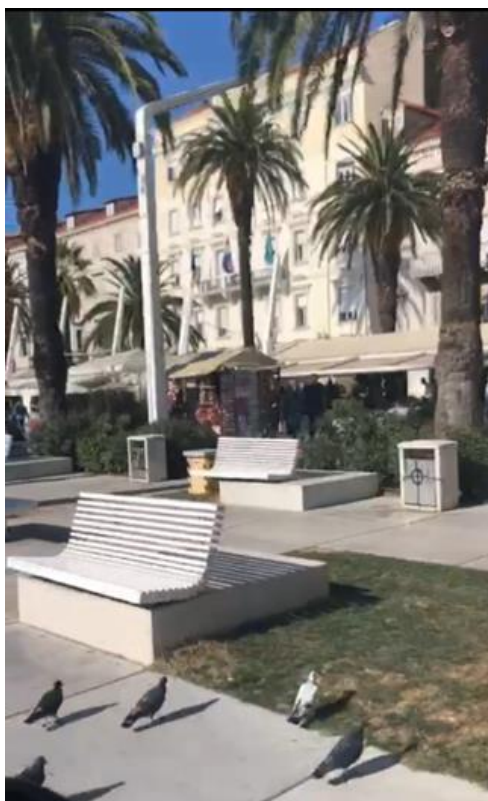
Sl. 12. Riva (zeleni dio uz more), 15. 7. 2019.