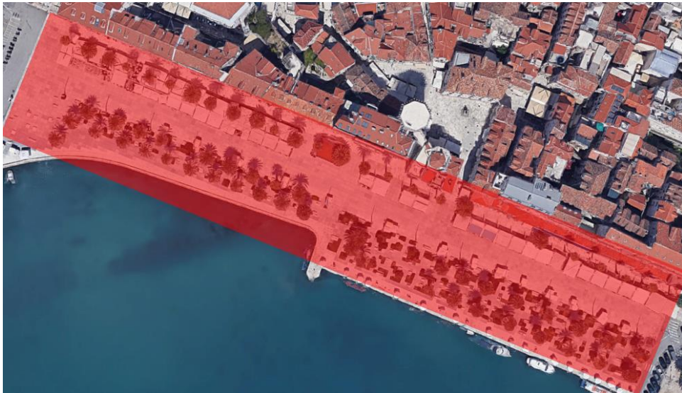
Sl. 6. Područje obuhvaćeno promatranjem označeno crvenom bojom

Promatranje je vršeno na prostoru splitske rive, službenog naziva Obala Hrvatskog narodnog preporoda u vremenskom periodu od lipnja, srpnja i kolovoza 2019. godine i prosinca 2019. godine, te siječnja i veljače 2020. godine. Promatranje se vršilo u ljetnom i zimskom periodu i to je omogućilo uvid u razlike između perioda turističke sezone koja obuhvaća ljeto i zime koja je najviše obilježena događanjem „Advent u Splitu“ u prosincu i siječnju i zaključno veljačom, kada nema više organiziranih događanja na prostoru Rive. Usporedba ljetnog i zimskog vremenskog perioda je omogućila uvid u razlike koje se događaju na prostoru Rive u kontekstu različitosti između aktera koji posjećuju prostor rive, njihovih aktivnosti, interakcije, prohodnosti/posjećenosti prostora i konteksta unutar kojega se navedene stavke odvijaju. Cilj ovog promatranja je bio dobiti uvid u društvene i prostorne odnose koji se odvijaju u različitim vremenskim periodima. Tablica promatranja se nalazi u prilogu zajedno s fotodokumentacijom promatranja.