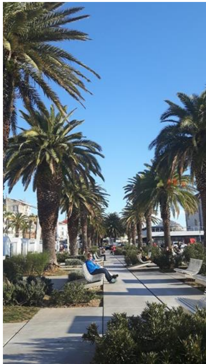
Sl. 28. Riva (zeleni dio uz more), 27. 12. 2019.