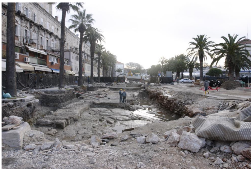
Sl. 3. Arheološka iskopavanja u vrijeme rekonstrukcije rive 2006./2007. godine

Od te posljednje izmjene do danas nije bilo nijedne nove modifikacije izgledu Rive.