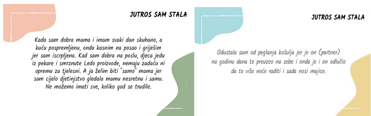
Slike 6 i 7. Ispovijedi pod #JutrosSamStala.

Uz ova istraživanja dodala bih i čestu sintagmu, koju koriste muškarci i žene: „Pomaganje muža ženi oko kućanskih poslova“. Smatram da ona zorno dokazuje kako je vezanost žena za privatnu sferu života i dalje činjenica. Koliko to onemogućava žene u posvećivanju profesionalnom životu, pomaže nam predočiti i kalkulator 16 , koji je izradila organizacija UN Women. Pomoću njega možete izračunati koliko ćete vremena provesti radeći neplaćene kućanske poslove tijekom života. Prema tim izračunima žene u prosjeku provedu 10 godina obavljajući takve poslove dok muškarci provedu četiri godine. Iz ovih istraživanja vidljivo je kako se o kućanskim poslovima može govoriti kao o vrsti kontrole ženskoga vremena čime se onemogućava njihovo ostvarivanje u javnoj sferi života. Ovdje držim važnim spomenuti i akciju Mreže „4. smjena – nevidljivi rad“ koja je 01. rujna 2021. pokrenula kampanju na društvenim mrežama putem #JutrosSamStala. Kampanja ima za cilj osvijestiti javnost o neplaćenom kućanskom radu koji uglavnom obavljaju žene, kao što je i dokazano prethodno iznesenim istraživanjima. Cilj kampanje je prikupiti priče o neplaćenom kućanskom radu putem društvenih mreža Instagram, Facebook, Twitter ili putem e-maila. Nakon čega se priče na istim društvenim mrežama i objavljuju.