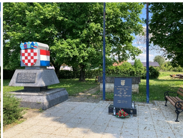
Slika 2. Spomen braniteljima u Ždali

Velike su promjene i u samim izgledima seoskih kuća. Grade se ili nadograđuju veće i modernije kuće, sa svim potrebnim osnovnim instalacijama pa se možemo složiti da „seoska je kuća, posve poprimila gradska obilježja.“ (Hodžić, 2006:94) na što ukazuju i naši kazivači: