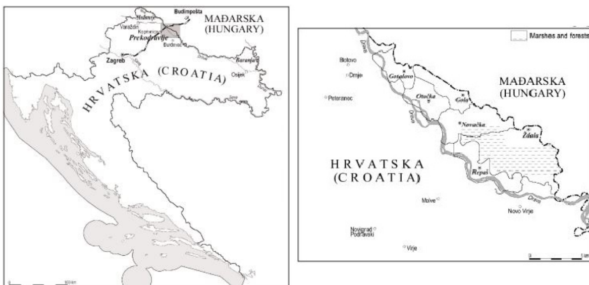
Slika 1. Prekodravlje, preuzeto iz Prekodravlje – Repaš: Razvoj naselja i stanovništva (Crkvenčić, 2003)

„Prekodravlje je pitom prostor Lijepa Naše, smješten između rijeke Drave i njezine lijeve pritoke Ždalice i Republike Mađarske. U tom, izrazito nizinskom prostoru dravske aluvijalne ravnice, nalaze se idilična sela Gola, Gotalovo, Novačka, Otočka, Repaš i Ždala“ (Zabjan, 2016:49).