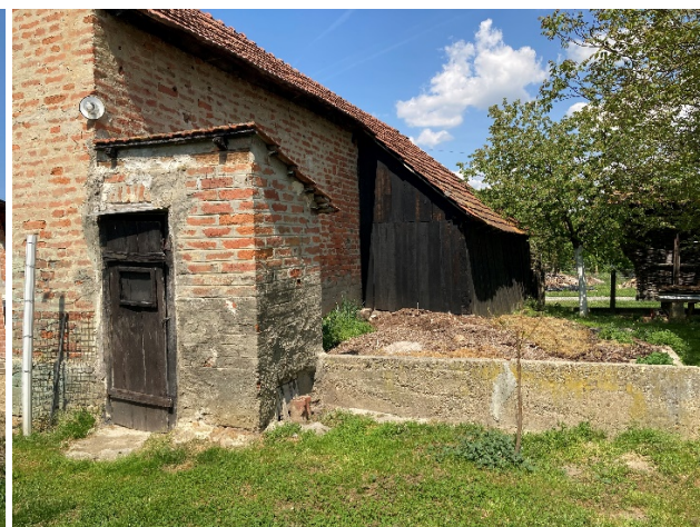
Slika 4. Stari napušteni poljski WC

Seoske su kuće danas sve veće i modernije i većina njih se u pravilu ne razlikuje s kućama u gradovima, a osnovna opremljenost je usvojena pa se po svemu izrečenom možemo složiti s navodom: „Kulturni standardi su postavljeni, oni su usvojeni, radi se samo o tome što ih jedni