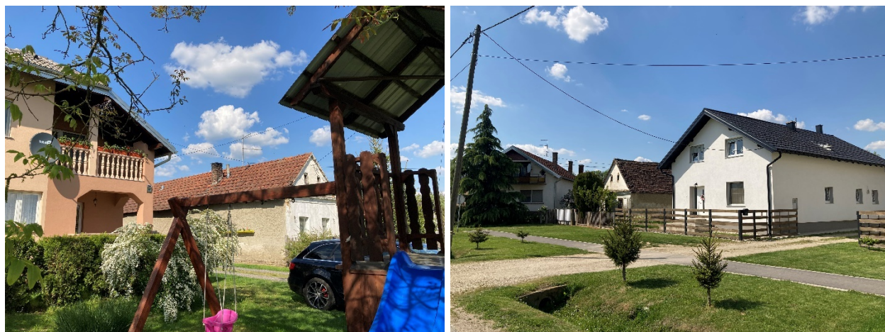
Slika 5. i Slika 6. Vizura sela i stapanje starih s modernim novim kućama

njima. Danas selo izumire što možemo vidjeti i po broju stanovništva. Nekad nas je bilo oko 500-600 ljudi sa biračkim pravom (od prvih izbora negdje 90-ih) dok je danas ta brojka ispod 400. Manje je djece i ljudi u selu, nema nikakve industrije koja bi recimo zadržala mlade ljude u selu koji se danas nažalost iseljavaju i odlaze u gradove ili inozemstvo. Danas je u selu svaka druga kuća napuštena i neodržavana.“ (Davor, 57)