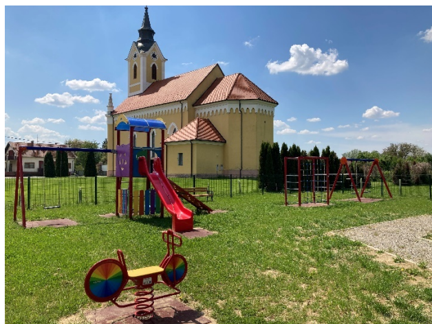
Slika 1. Novo dječje igralište u Ždali i crkva

„Promijenio se izgled sela, renovirali su se crkva i farof, stara škola je srušena pa je na tom mjestu izgrađeno dječje igralište. Dignuti su spomenici braniteljima Domovinskog rata, spomenik svetog Alojzija Stepinca, bista Franje Tuđmana ispred farofa. Asfaltirani su i neki poljski putevi.“ (Dino, 24)