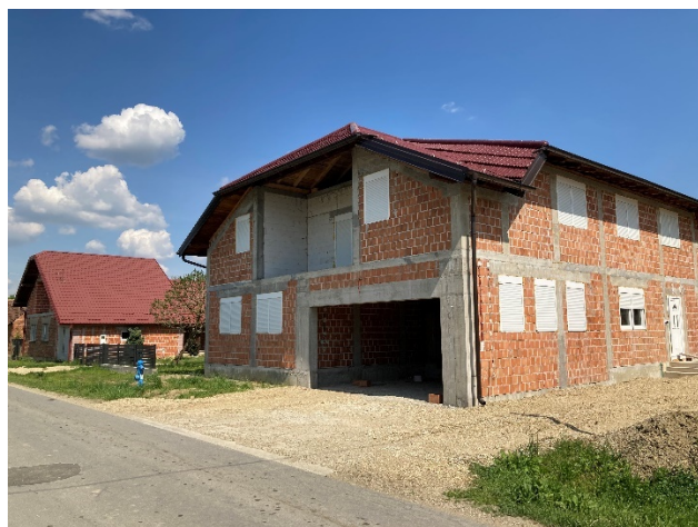
Slika 3. Izgradnja novih modernih kuća

„Kuće su puno bolje opremljene, mislim da nema nikakve razlike što se tiče kuhinje, kupaone, boravka. Sve mlade obitelji imaju ugrađene kuhinje, perilice, sušilice to je postalo potpuno isto kao i u gradu, a nekada nije toga bilo.“ (Maja, 61)