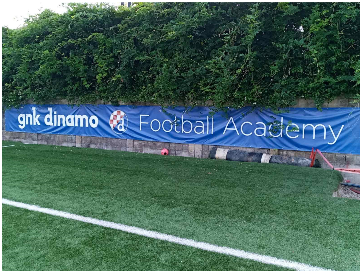
Slika 4. Barjak Dinamove nogometne akademije obješen na tivatskom igralištu, lipanj 2022.