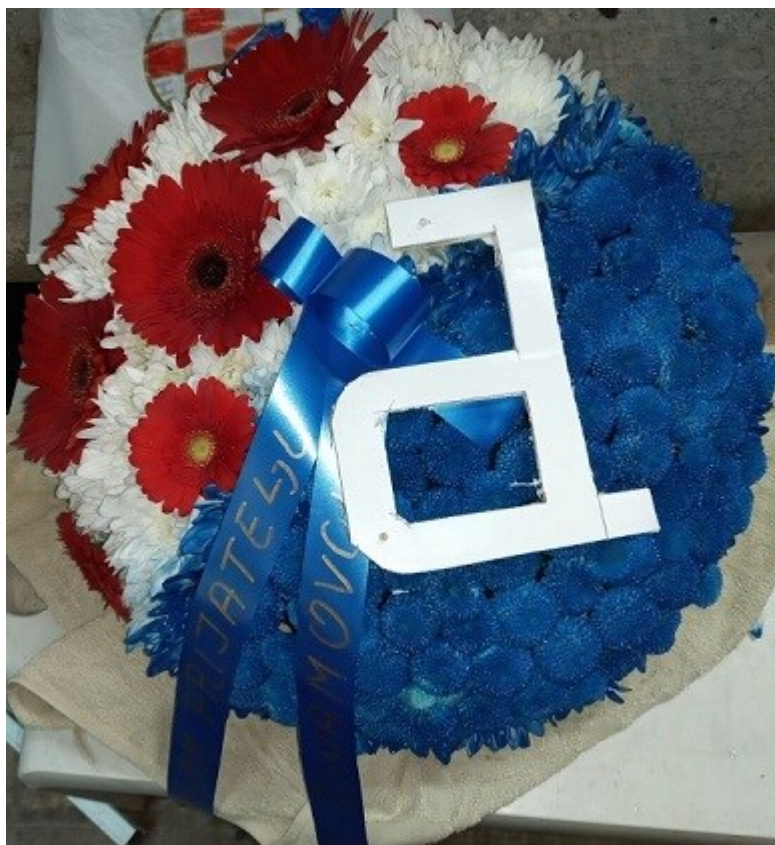
Slika 3. Crveno-bijelo-plavi vijenac stiliziran po uzoru na Dinamov grb, ukrašen vrpcom s natpisom „Dragom prijatelju, tvoji dinamovci“ sa sprovoda Ive Marića

DPH Tivat i Dinamov povjerenik za Crnu Goru pomažu zainteresiranim osobama u procesu učlanjivanja i obnove članstva. Godišnja članarina za HNK Hajduk iznosi 100 kuna (za maloljetne i osobe koje su navršile 65 godina 50 kuna) 9 , dok godišnja članarina za GNK Dinamo iznosi 60 kuna (za maloljetne i osobe koje su navršile 60 godina 40 kuna) 10 . Iziskujući prikupljanje tuđih novaca, proces prikupljanja članarine nezahvalan je u svojoj samoj biti, te je doveo do raznih strategija i prilagodbi. I gospodin Marić i gospodin Božinović istaknuli su da im članovi često plaćaju na odloženo: