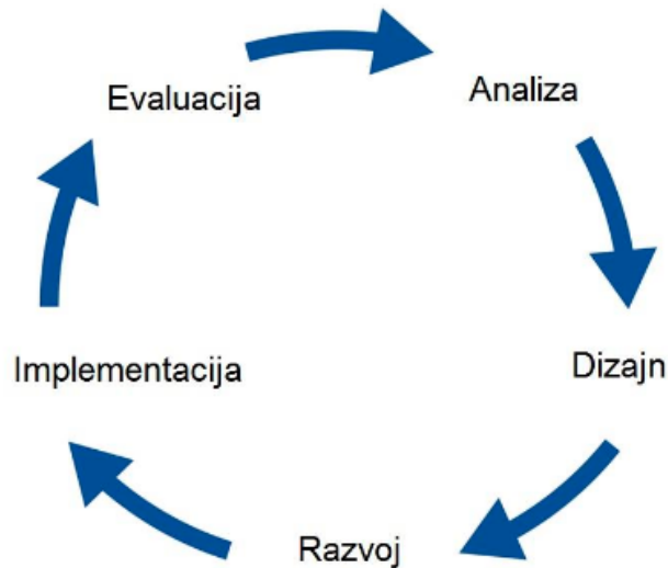
Slika 1. ADDIE model instruktivskog dizajna [10]