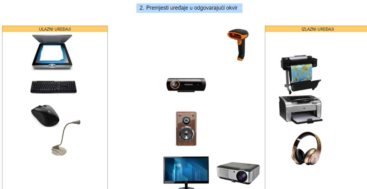
Slika 4. Ulazni i izlazni dijelovi računala – interaktivna igra za učenike [16]

Velika prednost gore navedenih i prikazanih kvizova kao i ostalih nastavnih materijala na mrežnim stranicama je da učenicima na interaktivan i zanimljiv način učenicima pomogne u savladavanju nastavnog gradiva te da ih čim bolje pripremi na provjere znanja u školi.