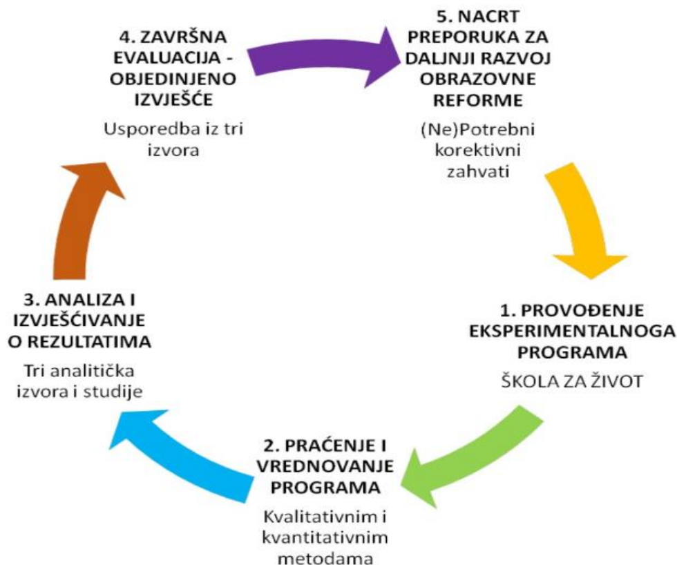
Slika 1 Formacijski koraci u vrednovanju provedbe eksperimentalnog programa

S provedbom eksperimentalnog programa započeo je i projekt njegovog praćenja i vrednovanja kojim se nastojala provjeriti primjenjivost novih kurikuluma, oblika i metoda rada te novih nastavnih sredstava obzirom na povećanje kompetencija učenika u rješavanju problema te povećanje zadovoljstva i motivacije učenika i njihovih učitelja u školi. Dodatno, važno obilježje programa jest provjera te osmišljavanje edukacije za nastavnike i učitelje kako bi se nove paradigme i koncepti uspješno primijenili u školskoj praksi. Potrebno je odrediti kvalitetu i koncept opreme i udžbenika te ulogu ravnatelja u školi koja treba težiti autonomiji i poticati slobodu učitelja i nastavnika da izabire najbolje za svoje učenike na temelju svojih stručnih i općih kompetencija. (MZOS, 2019.)