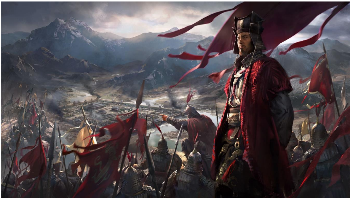
Slika 7. Prikaz igre Total War: Three Kingdoms

Igra započinje 190. godine, u kojoj je nekad slavna dinastija Han bila na rubu propasti. Ustoličenim djetetom Cao Xian, manipulirao je vojskovođa Dong Zhuo, u dobi od osam godina. Ugnjetavajuća vladavina Dong Zhuo-a dovodi do kaosa. Ustaju novi gospodari rata i formiraju koaliciju kako bi započeli kampanju protiv Dong Zhuoa. Međutim, budući da svaki vojskovođa ima osobne ambicije i neprestano mijenja veze, igrač mora koristiti strategiju i taktiku za ujedinjenje Kine i pisanje vlastite povijesti. (Fandom, n.d.)