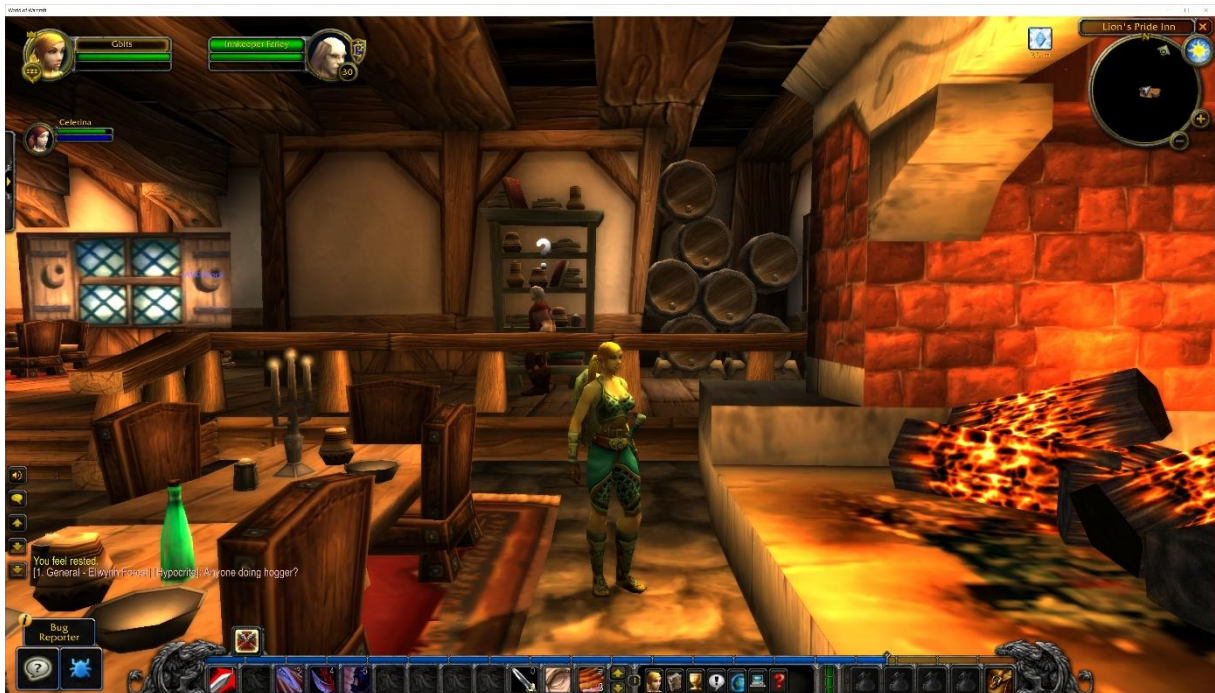
Slika 11. Prikaz igre Worl of Worcraft (Izvor: Newman, n.d.)

Igra je smještena u izmišljenom svijetu Azeroth-a, WoW omogućuje igračima da stvaraju likove u stilu avatara i istražuju prostrani svemir, dok komuniciraju s nerealnim igračima - zvanim ne-igrački likovi (NPC) - i ostalim stvarnim igračima (PC-ima). Razne misije, bitke i misije dovršavaju se sami ili u cehovima, a nagrade za uspjeh uključuju zlato, oružje i vrijedne predmete koji se koriste za poboljšanje nečijeg karaktera. Likovi napreduju ubijanjem drugih stvorenja kako bi stekli iskustvo. Jednom kada se stekne dovoljno iskustva, lik dobiva razinu koja povećava moći lika. Igrači mogu igrati kao druidi, svećenici, lupeži, paladini i druge satove povezane s fantazijom. (Britannica, n.d.)