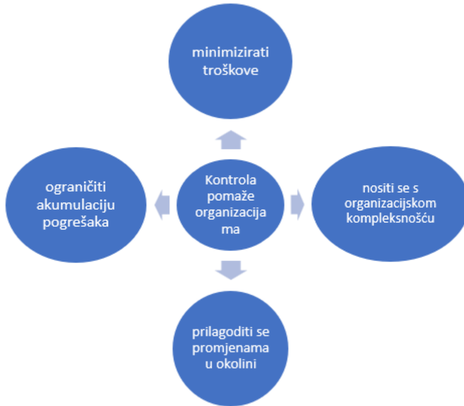
Slika 3. Svrha kontrole (izrada autora prema Sikavica i sur., 2008.)

Da bi se svrhe kontrole postizale kontrolu je potrebno provoditi sustavno kako bi se na vrijeme uočile nepravilnosti i problemi te kako bi se čim prije moglo krenuti s rješavanjem problema. Sustavno provođenje kontrole omogućava rješavanje manjih problema prije nego što oni izrastu u značajne probleme koje bi organizaciji bilo mnogo teže i zahtjevnije riješiti. Sustavna kontrola isto tako omogućava minimalizaciju troškova poslovanja tako što utvrđuje koji proizvod ili usluga najviše doprinose organizaciji, a koji proizvodi ili usluge nisu toliko isplativi.