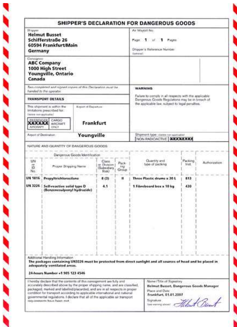
Slika 14 Dokument pošiljatelja za prijevoz opasnog tereta