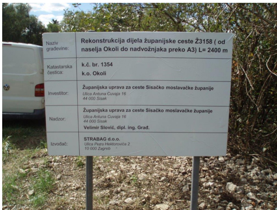
Slika 6. Rekonstrukcija županijske ceste Ž3158, proširenje kolnika