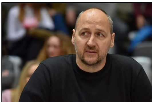
Slika 14: Dino Rađa

Dino Rađa rođen je u Splitu 24. travnja 1967. godine. Bivši je hrvatski košarkaš, a sada i jedan od vodećih članova HKS-a. Dvostruki je dobitnik Državne nagrade za sport "Franjo Bučar", prvo kao član reprezentacije 1992. i 2003. godine osobno.