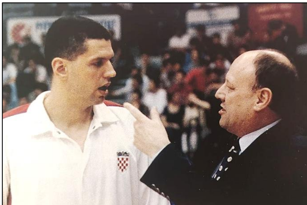
Slika 9: Dražen Petrović i Mirko Novosel

Mirko Novosel uvršten je 2007. u Hall of fame među najbolje trenere ikada. Bio je prvo igrač, a zatim i trener Lokomotive Zagreb. Godine 1973. vodi seniore Jugoslavije do zlatne europske medalje, a taj uspjeh ponavlja i dvije godine nakon, dok 1976. osvaja srebrnu olimpijsku medalju. Zlatnu kolajnu s s OI osvaja 1984. godine. Osvojio je sedam kupova Jugoslavije s Cibonom, a 1985. proglašen je i europskim trenerom godine. Bio je direktor hrvatske reprezentacije, a 1993. posljednji je put bio izbornik hrvatske košarkaške reprezentacije s kojom je tada na EP osvojio broncu (isto).