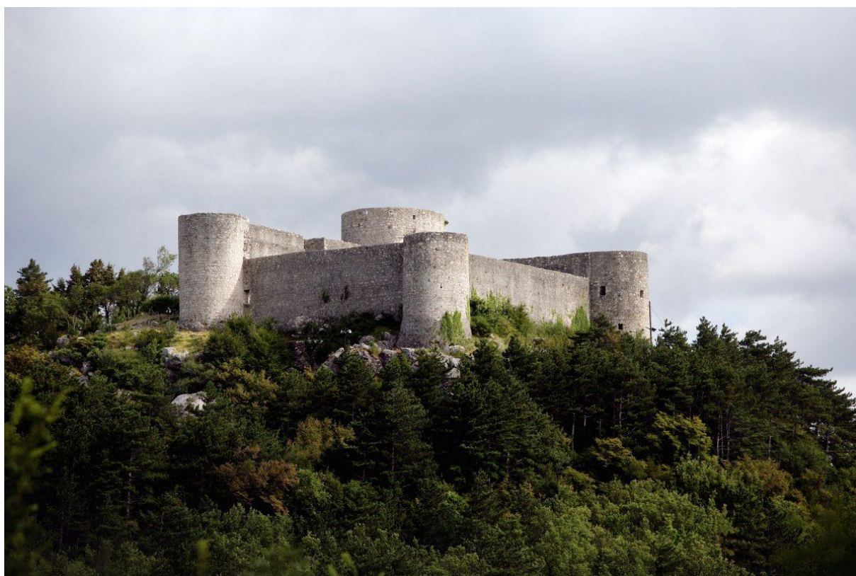
Slika 10 Kaštel Drivenik