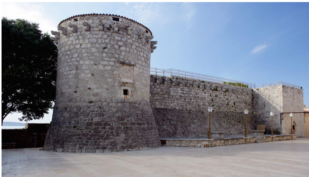
Slika 2 Kaštel u Krku