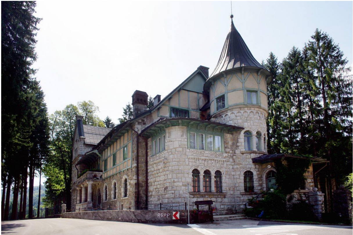
Slika 19 Dvorac Stara Sušica