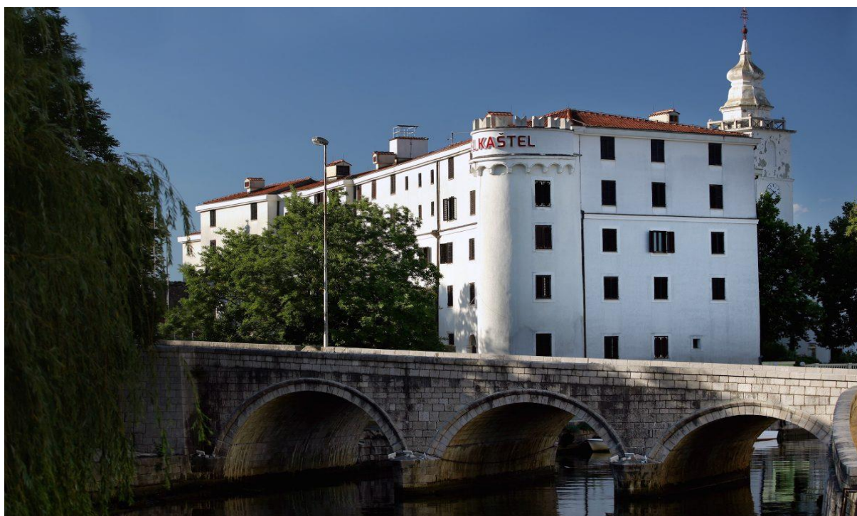
Slika 12 Hotel „Kaštel“