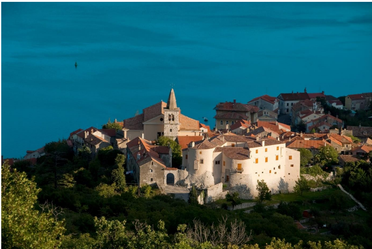
Slika 6 Kaštel u Bakru