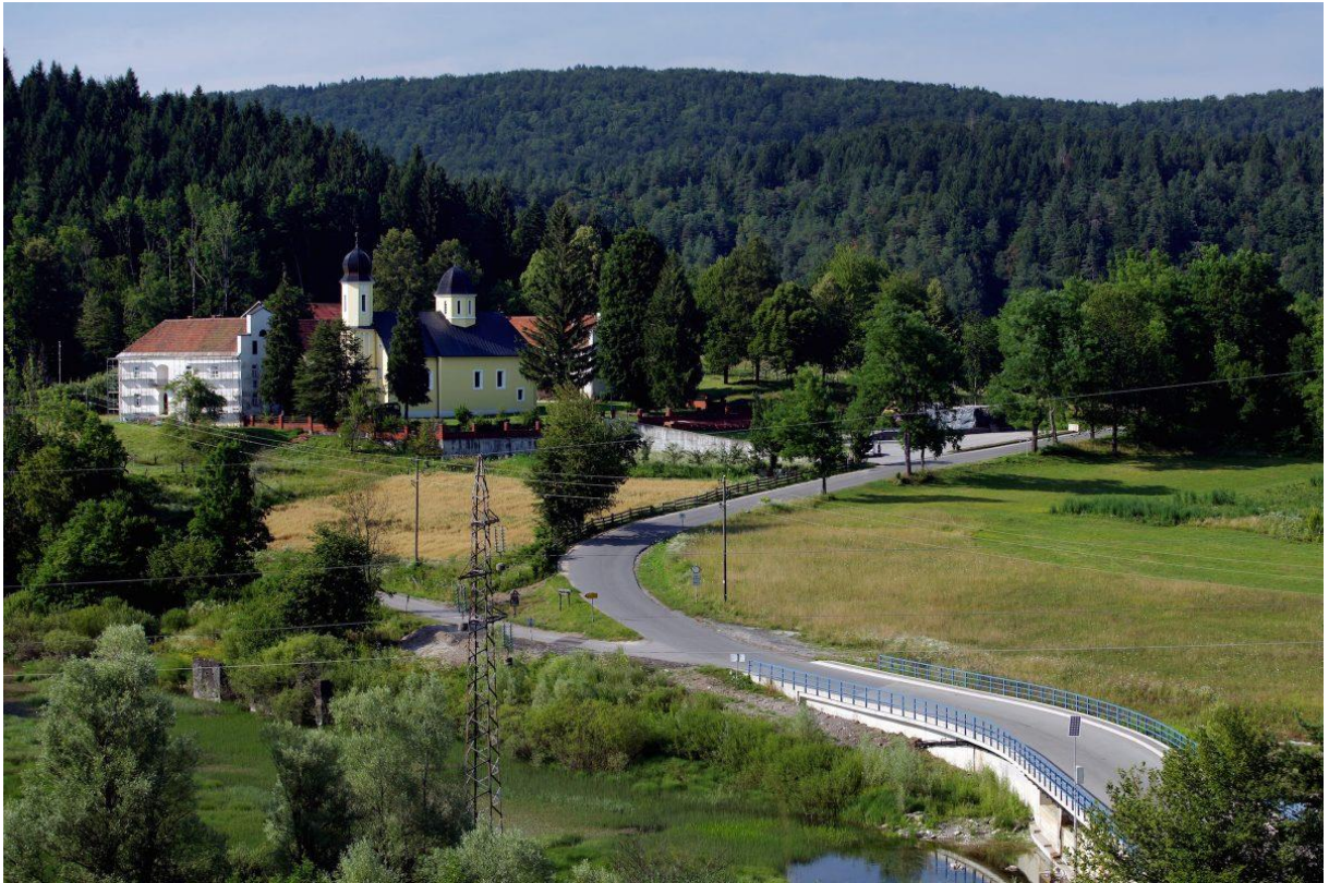
Slika 20 Manastir Gomirje