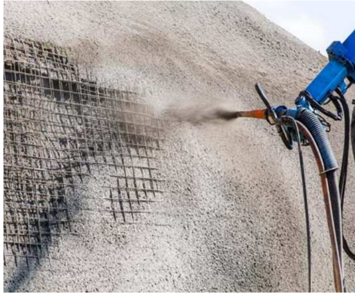
Slika 23.: Mlazni beton [23]