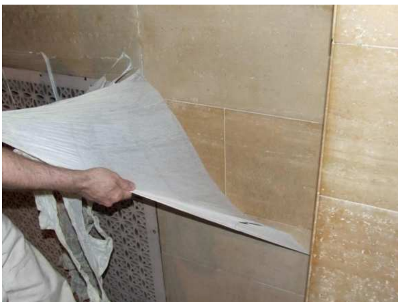
Slika 18.: Čišćenje pastom [18]

Vrlo je učinkovita i uklanja velik broj mrlja kojih se ostalim metodama nije moguće riješiti. [13]