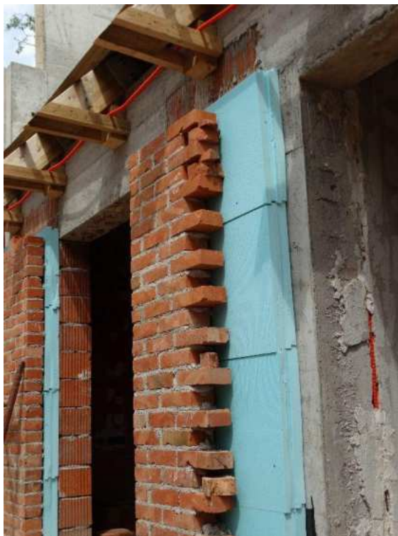
Slika 28.: „Sendvič zid“ [28]