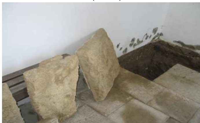
Slika 29.: Vлага koja prodire iz poda [29]

Radovi na sanaciji kapela od vlage su se pokazali nužnima. U donjim dijelovima zidova uklonjena je žbuka kako bi se zidovi mogli pravilno prosušiti. Oko građevine izvedena je vanjska drenaža s kojom je povezana unutrašnja drenažna cijev postavljena pod kutom. Kod saniranja unutrašnjosti oprezno su se skidale kamene podne ploče kako se ne bi oštetile.