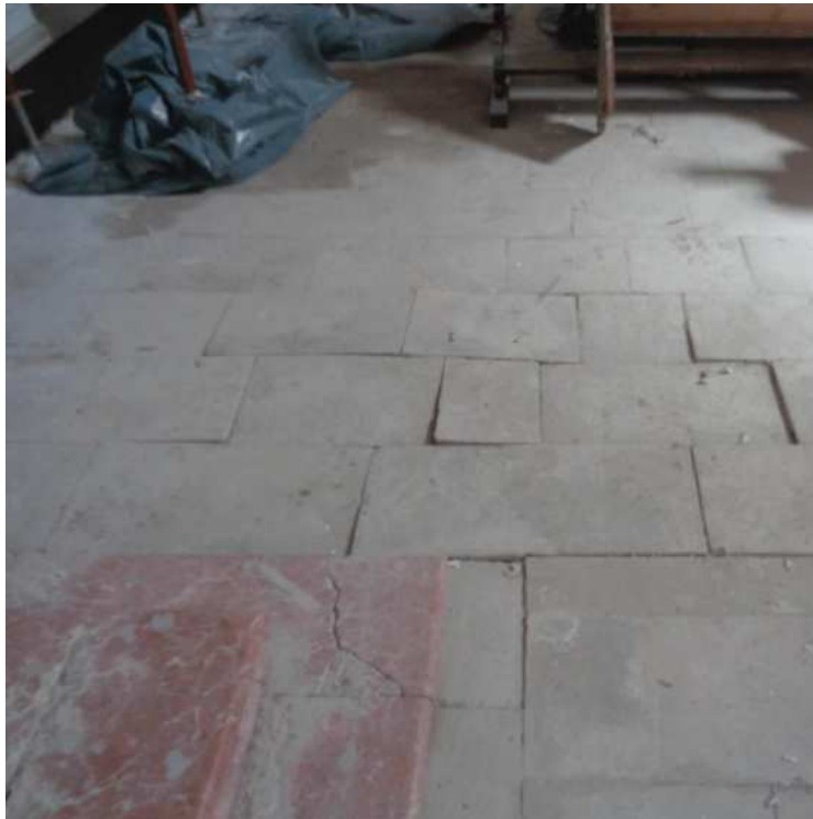
Slika 31.: Pod crkve prije obnove [31]

Za hidroizolaciju poda, nanesena je polimer – cementna hidroizolacija. [16]