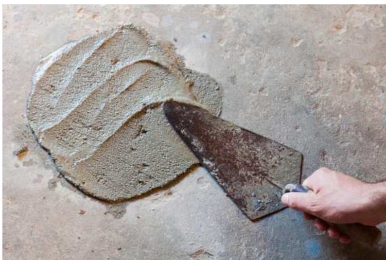
Slika 22.: Krpanje cementom [22]

Zakrpe visoke čvrstoće koriste krute i suhe mješavine pa su pogodne za vertikalne elemente. Uspješni su u saniranju oštećenja i puknutih mjesta u betonu.