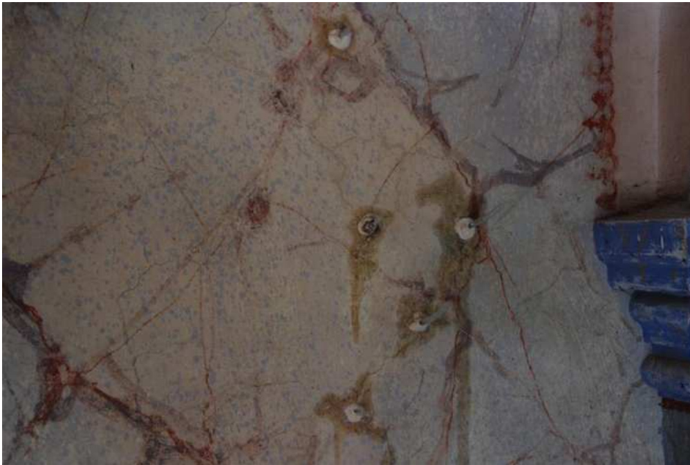
Slika 30.: Injektiranje pukotina [30]

Utjecaj vlage bio je također vidljiv u unutrašnjosti na osliku. Njega se uspješno saniralo skidanjem žbuke te procesom injektiranja oštećenih dijelova. [15]