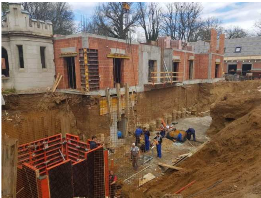
Slika 27.: Iskop do temelja [27]

Građevina je smještena pored šume. Tlo na kojem se objekt nalazi je pijesak koji je poznat po držanju vlage, ali i voda može bez problema otjecati.