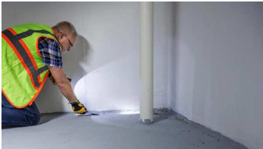
Slika 13.: Vizualna inspekcija [13]