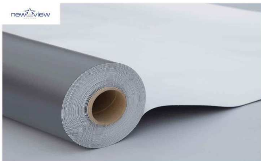
Slika 4.: PVC membrana[4]

PVC membrane ili membrane od polivinil klorida izrađuju se od PVC smole s dodatkom plastifikatora, UV stabilizatora i drugim aditiva. Lako se postavlja i dužeg je vijeka trajanja u odnosu na ostale proizvode (preko 20 godina za krovove, a 50 godina za podzemne prostore).