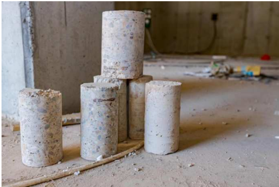
Slika 15.: Uzimanje uzoraka betona [15]

U slučajevima u kojim se uzrok ili ozbiljnost oštećenja ne može odrediti vizualnim ili nerazornim postupkom, morat će se ipak ukloniti dijelovi elemenata za koje se smatra da su kritični. Uzimaju se uzorci tipa jezgra, dijelovi zidova oko prozora ili dijelovi žbuke. Izdvojeni uzorci idu u laboratorij na daljnju analizu. Najčešće se ispituju tlačne ili vlačne čvrstoće materijala, ali provode se i kemijske analize kao i provjera uzorka na nepoželjne sastojke (kao kloride ili sulfite).