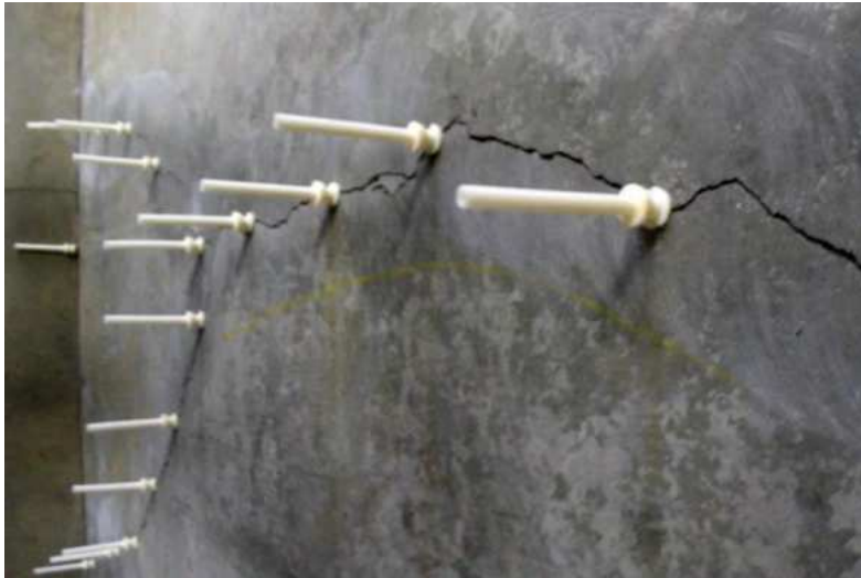
Slika 21.: Injektiranje epoksidnom smolom [21]

Proces ubrizgavanja provodi se pritiskanjem smole kroz otvore pukotine, a ako je riječ o većim pukotinama, otvori se buše i koriste se posebni uređaji koji osiguravaju kvalitetnu ispunu pukotine. Injektiranje kreće od najnižih otvora. Ovisno o karakteristikama same pukotine, curenje epoksida mora se spriječiti sa odgovarajućih strana elementa, drugim riječima, mora se pažljivo kontrolirati sveukupni proces ubrizgavanja.