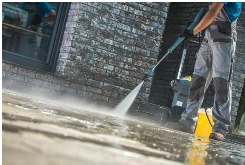
Slika 16.: Čišćenje vodom pod pritiskom [16]

Od štete najsigurnija metoda je natapanje vodom. Njome se stvara konstantan sloj vode na fasadi zgrade te nakon perioda natapanja, uklanja se pod pritiskom. Ipak, glavna mana ovog postupka je što se radi o velikim količinama vode koja može prodrijeti unutar fasade i opet stvoriti dodatne probleme. Namakanje vodom je dugotrajan proces jer naknadno sušenje fasade može potrajati tjednima.