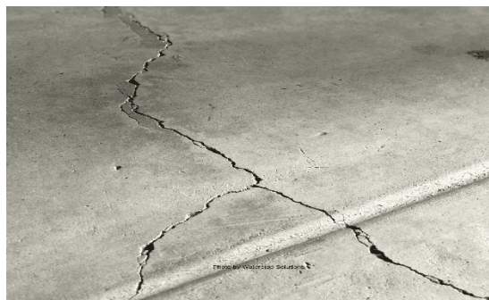
Slika 9.: Pukotine u betonu [9]

Treba voditi računa o pravilnoj ugradnji samog betona kako bi se kvalitetno stvrdnuo i smanjio rizik od stvaranja od pukotina. U protivnom, hidroizolacija će biti neuspješna i trebat će ju sanirati. [1]