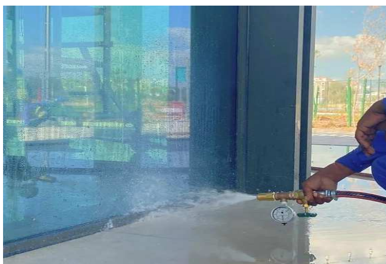
Slika 14.: Testiranje fasade vodom [14]

Testiranje vodom je jedna od češćih metoda koja se koristi u praksi. Voda se postupno primjenjuje na dijelove zgrade kako bi se utvrdilo događa li se igdje curenje ili upijanje vode. Njome se otkrivaju mjesta curenja, ali ne i uzrok.