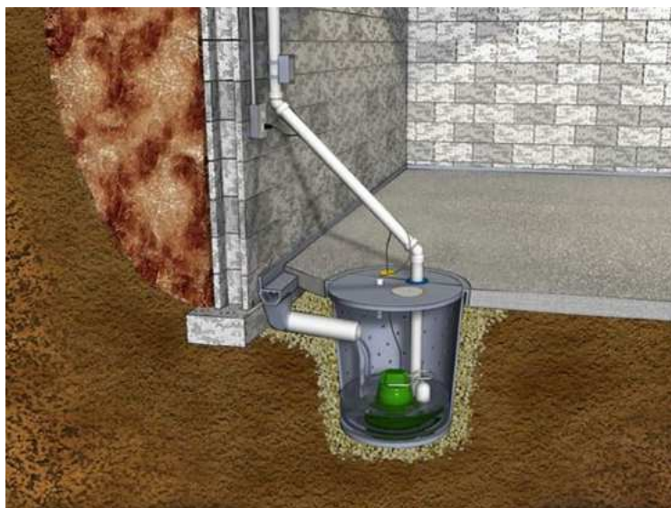
Slika 25.: Pumpa za odvodnju vode [25]

U čestoj upotrebi je i ugradnja pumpe koja odvodi i preusmjerava vodu što dalje od objekta. Takav sustav u kombinaciji sa sanacijom spojeva obično je zadovoljavajuće rješenje.