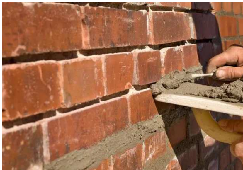
Slika 19.: Fugiranje zida [19]

Fugiranje je postupak uklanjanja starog morta iz spojeva i nanošenje novog. Sam proces je radno zahtjevan pa se često razmatraju ostale metode sanacije.