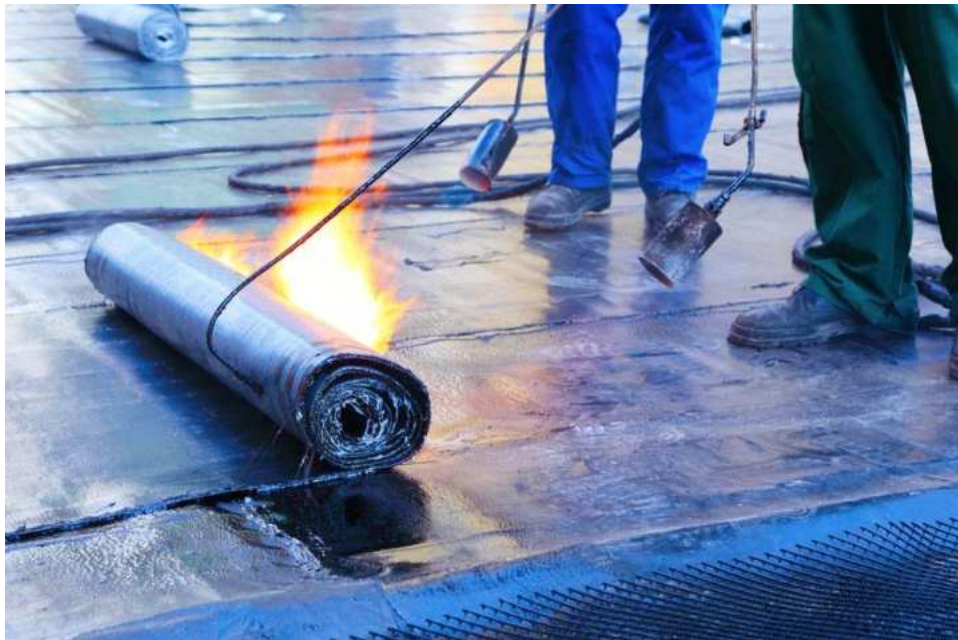
Slika 2.: Bitumenske membrane [2]

postupkom. Zahtijevaju precizno izvođenje i obavezno se postavljaju na ravnu površinu, bez ikakvih šupljina i nepravilnosti. [6]