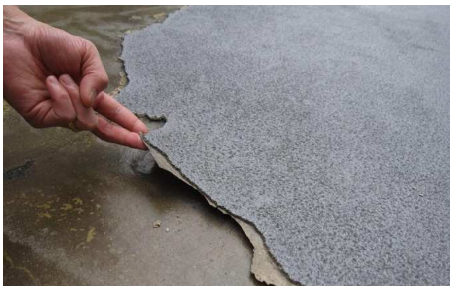
Slika 6.: Posljedice lošeg izvođenja [6]

Nepromišljena praksa uključuje nepravilnu pripremu površine prije nanošenja materijala, neravnomjerne premaze ili nedovoljno vrijeme sušenja određenih proizvoda. Isto tako, posebnu pozornost treba obratiti na mjesta kao što su balkoni i prozori kod kojih može doći do prodora vode ako se radi o nepravilnoj izvedbi. [10]