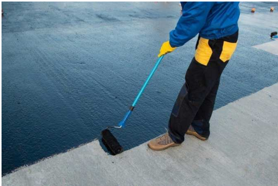
Slika 1.: Bitumenska boja [1]

Bitumenska boja je fleksibilnog tipa i nanosi se valjcima ili četkama. Predviđena je za veće površine u obliku završnog sloja i osnovnog premaza za membranu. [5]