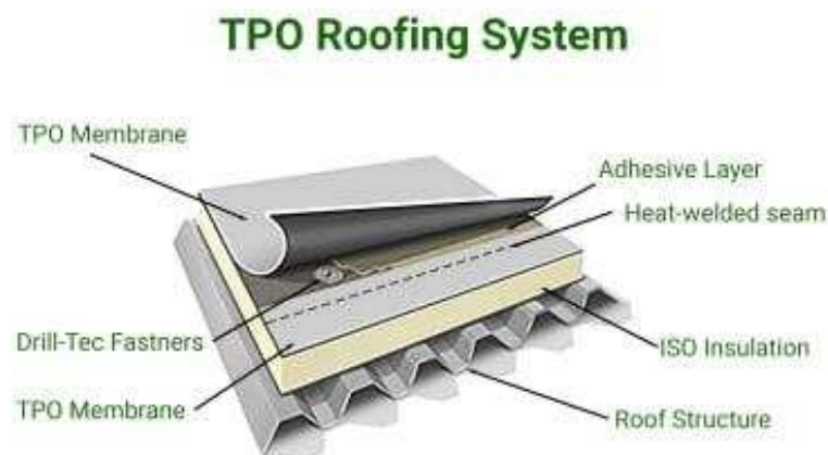
Slika 5.: Postavljanje TPO membrane

TPO membrane su jeftinije varijante PVC membrana što ima znatnu ulogu u odabiru proizvoda, kao što je već rečeno. [9]