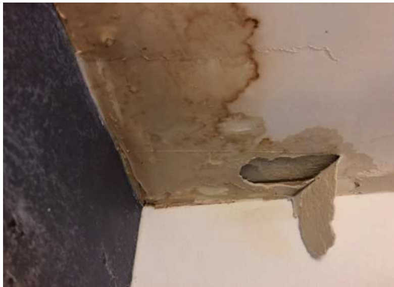
Slika 10.: Oštećenje konstrukcije od vlage

Bilo da se radi o drvenoj, betonskoj ili metalnoj konstrukciji, dugoročni utjecaj vlage uništava njezine dijelove. Elementi koji su napadnuti mogu biti nosivi čime se ugrožava i sama stabilnost konstrukcije. Što se kasnije reagira na problem, to troškovi sve više i više rastu. A popravci te vrste, koji uključuju potpunu sanaciju ili zamjenu pojedinih elemenata, mogu biti osjetno skupi.