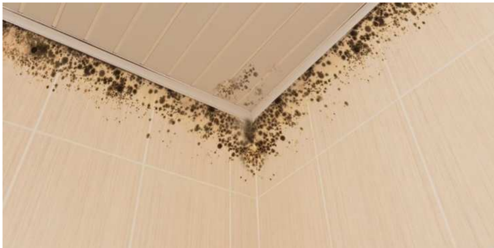
Slika 11.: Plijesan u kupaonici [11]