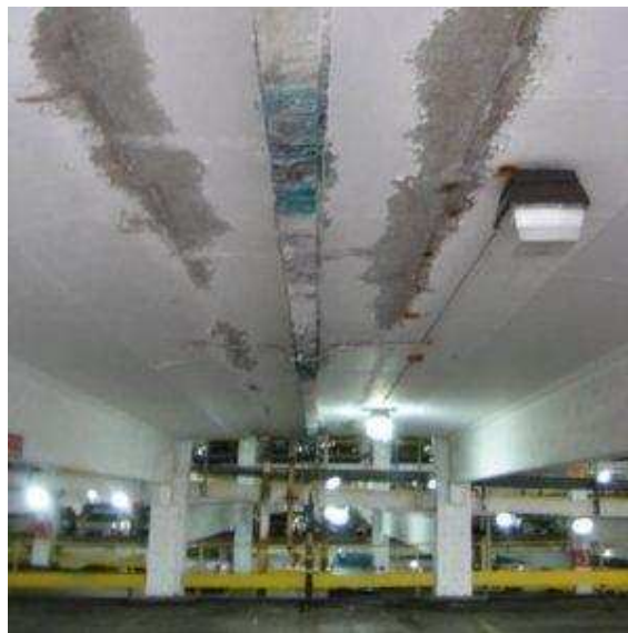
Slika 8.: Curenje na mjestima spojeva [8]

Isto tako, prisustvom vibracija, bilo od potresa, građevinskih radova ili gustoće prometa, dolazi do narušavanja sustava hidroizolacije. [10]