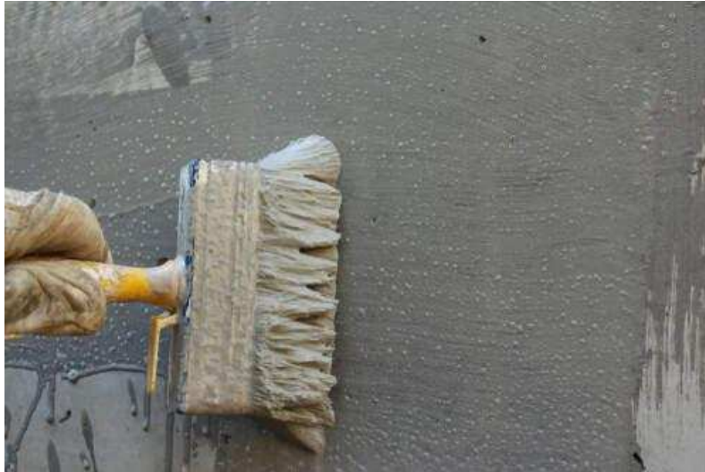
Slika 3.: Cementni premaz [3]