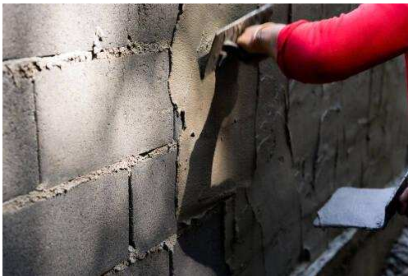
Slika 20.: Lično fugiranje [20]

Nakon detaljnog čišćenja zida, predviđeni materijal se utrljava u zid kružnim pokretima čime se ispunjavaju sva oštećenja. Prije nego dođe do stvrdnjavanja, fuga se odstrani obično četkom čime se ostvaruje ujednačena površina.