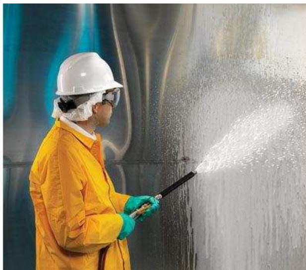
Slika 17.: Kemijsko čišćenje [17]