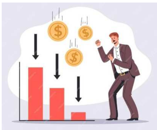
Slika 12.: Ilustracija pada vrijednosti [12]

Neriješene štete od vlage dodatno otežavaju sam proces prodaje. Ako se problemi zanemaruju, na kraju krajeva sama vrijednost nekretnine pada. Troškovi popravaka rastu i onda padaju u ruke kupcima. Dakle, kao što je već napomenuto, prisutnost vode u unutrašnjosti konstrukcije te njeno ignoriranje dovodi do rastućih troškova i nimalo nije ekonomski isplativo. [10]