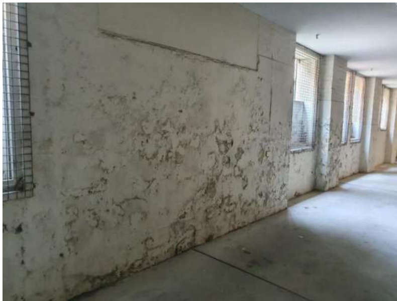
Slika 7.: Posljedice neodržavanja

Čak i manja curenja ili pukotine ne treba zanemariti jer mogu dovesti do značajnih posljedica uslijed širenja vode kroz kritične dijelove konstrukcije. Redovito održavanje brtve na prozorima i vratima ima isto tako veću važnost. Ako se bilo kakav defekt uoči ne smije se zanemariti i treba se prijaviti stručnim osobama kako bi se sanirao na ispravan način. [11]