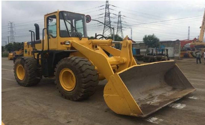
Slika 2: Utovarivač