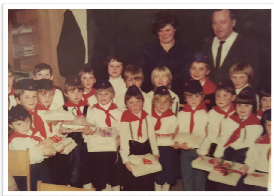
Slika 3. Pioniri područne škole Taborsko, godina nepoznata, fotografija u vlasništvu Zorice Korbar.