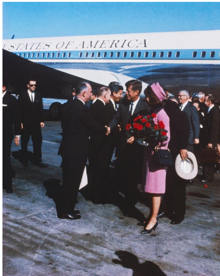
Slika 2- Ružičasto odijelo Jackie Kennedy

stražnjem dijelu automobila. Iako je tada uspjela zadržati svoje dostojanstvo pred kamerama, ružičasto odijelo Jackie Kennedy bilo je prekriveno krvlju. Ono što je posebno značajno za ovaj događaj je to što je Jackie kasnije odbila skinuti odijelo uz odgovor kako želi da svi vide što su učinili njenom suprugu. Te riječi su zauvijek ostale zapisane u povijesti, a tim je postupkom neverbalne komunikacije kroz odjeću, poslala snažnu poruku da je njezin suprug ubijen (Castanheira, 2023). Ovom gestom nije samo komentirala tragičan događaj, već je izražavala i svoju duboku žalost, šok i suprotstavljanje nasilju koje se dogodilo. Tako je ova gesta idealan pokazatelj kako odjeća može prenositi duboke emocionalne poruke, često s većom snagom i suptilnošću nego što to riječi mogu postići. Kći para, Caroline Kennedy, donirala je odijelo Nacionalnom arhivu Sjedinjenih Američkih Država, a od tada se isto nalazi van glavnog grada (Castanheira, 2023).