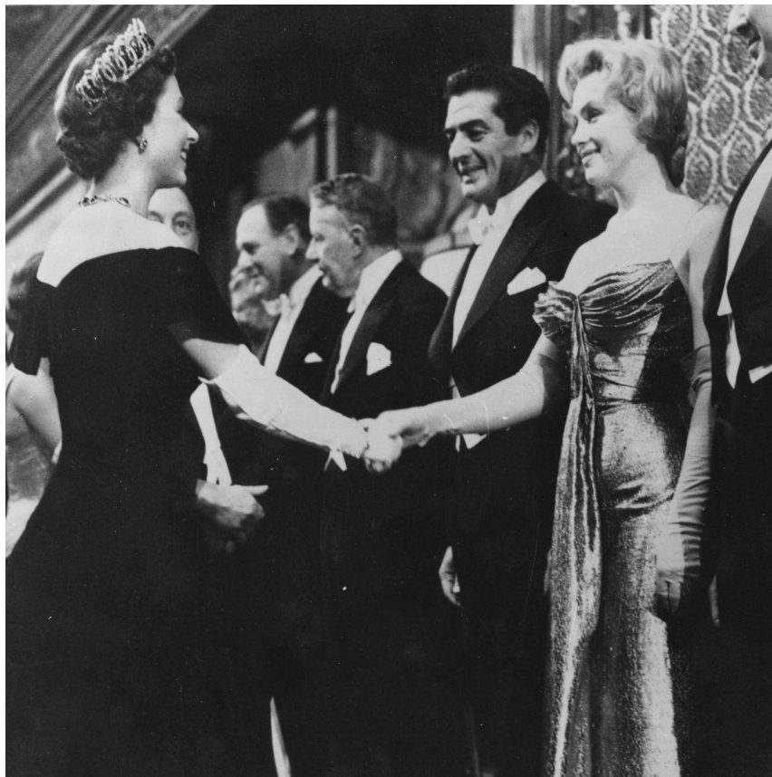
Slika 3- Marilyn Monroe u haljini koju je nosila prilikom upoznavanja s kraljicom Elizabetom II

Još jedan primjer vizualnog komuniciranja odjećom je i onaj glumice, pjevačice, modela i pop ikone Marilyn Monroe. U ranim godinama svoje modelske karijere Marilyn je naučila kako pomoću šminke i odjeće može stvoriti vlastiti imidž i slati jasne poruke, a kako navodi Jeffrey Meyers u knjizi The Genius and the Goddess: Arthur Miller and Marilyn Monroe (2010: 27), Marilyn je u početku težila da bude poželjna, pa joj je odjeća pomagala u stvaranju imidža filmske dive. Najupečatljiviji primjer komuniciranja odjećom, kada je u pitanju Marilyn Monroe je haljina koju je nosila prilikom upoznavanja s britanskom kraljicom Elizabetom II (Slika 3). Kako je navedeno u modnom magazinu Grazia (2022), ove dvije značajne žene upoznale su se 1956. godine na jednoj predstavi u Londonu. Ono što je obilježilo njihov susret je haljina izraženog dekoltea s kojom je Marilyn prekršila protokol o odijevanju koji je bio zatražen prije dolaska na predstavu. Njezina duga haljina, iako elegantna u svom kroju, bila je definitivno izvan okvira konzervativnosti. Zlatna haljina sa svojim tankim naramenicama i dubokim dekolteom, jasno je naglašavala njezine ženstvene obline i atraktivnost kao i odlučnost da se istakne na događaju. Poruka koju je svojim odabirom odjeće poslala je da je samouvjerenija i spremna istaknuti svoju osobnost i stil, čak i ako to znači odstupiti od očekivanja ( Grazia , 2022).