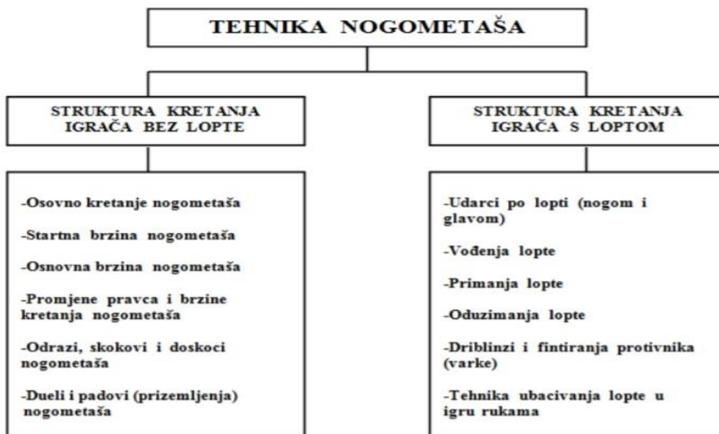
Prikaz 2. Shematski prikaz kretnih struktura nogometne tehnike (Jerković, 1991)