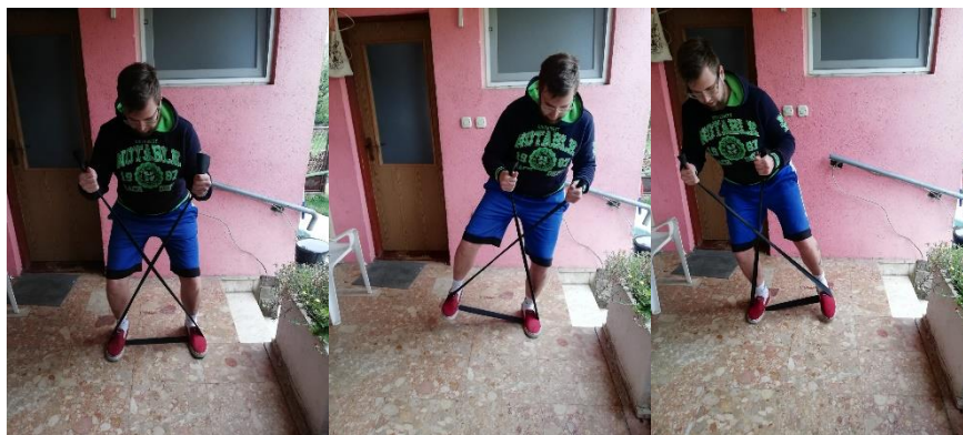
Slika 21. Kretanje u košarkaškom stavu pomoću rastezljive trake