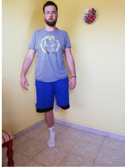
Slika 15. stoj na jednoj nozi na tvrdoj i mekoj podlozi

Naravno tu vježbu možemo dodatno otežati na način da sportaš mijenja ruku s kojom vodi loptu, dribling prednje promjene, vježbe bacanja i hvatanja isto tako u više varijacija. Ravnotežni položaj na jednoj nozi trebalo bi zadržati najmanje 30-40 sekundi i ponavljati to isto u 3-4 serije s 10 sekundi pauze između serija (slika 15.).