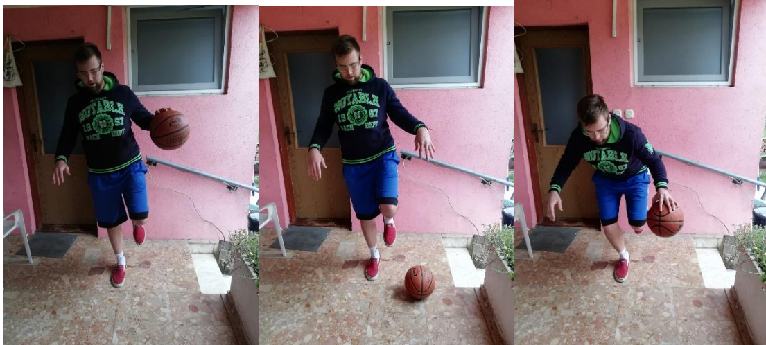
Slika 23. vođenje lopte na jednoj nozi u različitim pozicijama

Potrebno je odraditi barem dvije minute efektivnog vođenja lopte i po dvije do tri serije. Pauza od 20 sekundi između serija (slika 23.).