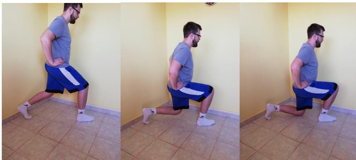
Slika 19. čučanj u iskoračnom stavu

Sportaš zauzima iskoračni položaj gdje je težište prebačeno na prednju nogu. Sportaš se polako spušta do poda, a ukoliko je u mogućnosti spuštati se do poda dok koljeno stražnje noge ne dotakne pod. Prilikom spuštanja učestala pogreška je ta da sportašu koljeno prelazi projekciju prstiju ili da koljeno upada prema unutra stoga je potrebno konstantno ispravljati sportaša. Potrebno je u ovoj vježbi mijenjati prednju nogu, svaka noga radi 2-3 serije s 8-12 ponavljanja (slika 19.).