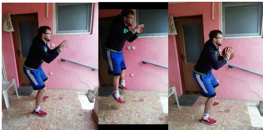
Slika 22. hvatanje lopte u skoku iz obrambenog košarkaškog stava

Sportaš se nalazi u obrambenom košarkaškom stavu bez lopte. Na znak trenera sportaš sunožno skače prema naprijed i prima loptu koju mu dodaje trener. Ovu vježbu je moguće kasnije dodatno zakomplicirati na način da se sportaš odražava s jedne noge, a prilikom doskoka isto tako je moguć doskok na jednu nogu ili na obje noge što je za početak sigurnija solucija. Potrebno je odraditi 10 skokova u 2-3 serije (slika 22.).