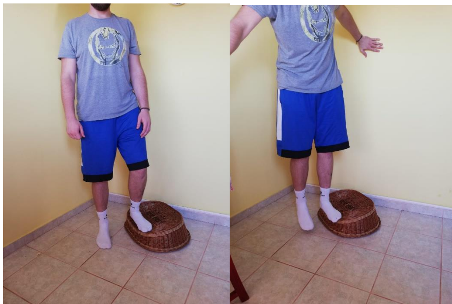
Slika 18. prijenos težine s ne ozlijeđene noge na ozlijeđenu nogu