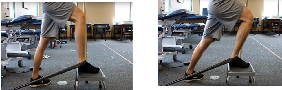
Slika 16. Pokret uz mobilizaciju uz pomoć elastične trake

Mulliganov-a vježba, poznatija kao pokret uz mobilizaciju. Vježba se provodi na način da sportaš podigne nogu na povišenje te na području talusa stavi elastičnu traku i zakači ju za nekakav uteg ili omota oko nekog objekta kako bi se traka napela do željenog otpora. Iz početnog položaja, sportaš gura koljeno noge koja se nalazi na povišenju prema naprijed pritom ne podižući petu s podloge, a zatim ponovno vraća u početni položaj. U ovoj vježbi je česta pogreška propadanje koljena prema unutra. Potrebno je konstantno ispravljati sportaša u izvedbi kako se ta greška ne bi pojavljivala. Odraditi 10-12 ponavljanja i 2-3 serije (slika 16.).