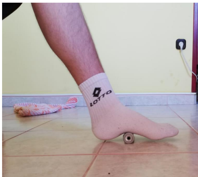
Slika 13. rolanje donjeg dijela stopala

Vježba valjanja donjeg dijela stopala. Vježba se provodi na način da se sportaš nalazi u sjedećem ili stojećem položaju, a na podu ispred se nalazi valjkasti objekt ili igličasta loptica. Sportaš stavi stopalo na valjkasti objekt ili na lopticu te laganim pokretima stopala prema naprijed i prema natrag inervira donji dio stopala. Ova vježba se pokazala korisnom u svrhu razvoja propriocepcije i razvoj osjećaja u stopalu. Vježbu treba provoditi 30-40 sekundi naizmjenično jedna pa druga noga po 2-3 serije 2-3 puta dnevno (slika 13.).