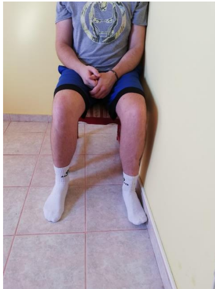
Slika 8. Inverzija i everzija izometrične kontrakcije