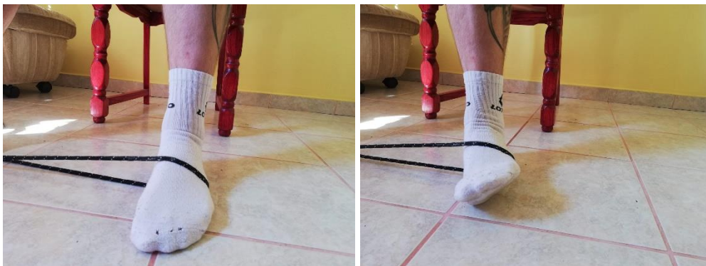
Slika 9. i 10. everzija stopala uz pomoć rastezljive trake

Ova je vježba slična prošloj vježbi samo što neće biti prisutna izometrička kontrakcija, a umjesto zida će se koristiti rastezljiva traka. Sportaš u sjedećem položaju omota traku oko članaka nožnih prstiju i izvodi koncentričnu kontrakciju u inverziji i u everziji u obje varijante. Potrebno je napraviti 10-15 ponavljanja, 2-3 serije, 2-3 puta dnevno (slika 9. i 10.).