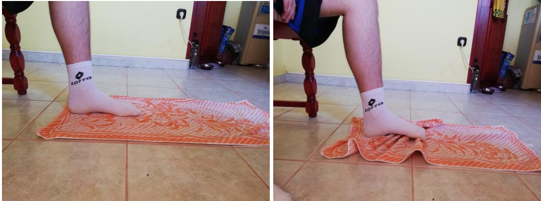
Slika 12. povlačenje ručnika prstima u sjedećoj ili stojećoj poziciji

jedan kraj ručnika i grabi prstima nastojeći privući cijeli ručnik prema sebi. Vježba se provodi u 4 serije sa po 10 ponavljanja u svakoj seriji. Osoba smije prijeći na povlačenje većeg opterećenja tek nakon što je u 4. seriji uspješno napravljeno svih 10 ponavljanja s pravilnim obrascem pokreta (slika 12.).