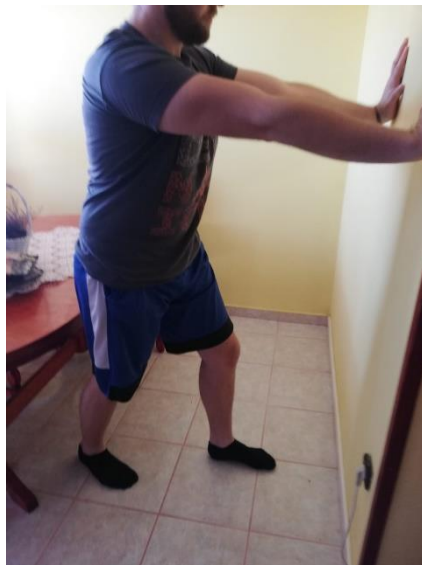
Slika 14. varijacije istezanja ahilove tetive.

Vježba istezanja ahilove tetive izuzetno je bitna u ranijim fazama rehabilitacije kako nebi došlo do pretjerane kontrakcije mišića stražnje strane potkoljenice. Osoba se nalazi u uspravnom položaju licem okrenutim prema i rukama postavljenima na zid. Jednom nogom iskoračimo naprijed, a noga koju istežemo nalazi se iza s petom postavljenom na podu i mora se voditi računa da se ne odigne s poda. Varijacija na ovu vježbu je ta da se stopalo jedne noge postavi na platformu koja ima nagib. Nakon što smo postavili nogu te zauzeli upravan položaj, polagano prebacujemo težište tijela naprijed prema zglobu i vraćamo se natrag (slika 14.).