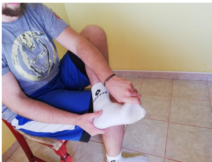
Slika 11. istezanje palca u sjedećem položaju.

Vježba istezanja ekstenzijom palca. Sportaš samostalno provodi ovu vježbu na način da se nalazi u sjedećem položaju gdje uhvati drugu nogu i postavi je na nogu koja nije zljeđena i nalazi se na podu. Sportaš uhvati palac s rukom i polako ga povlači prema nazad ne prelazeći granicu boli. Istegnuti položaj se mora zadržati 15-30 sekundi nakon čega kreće lagano opuštanje 10 sekundi i zatim opet ponoviti proces u 2-3 serije (slika 11.).