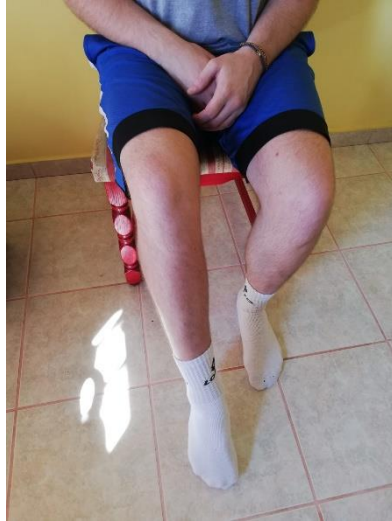
Slika 7. ispisivanje abecede u sjedećem položaju na stolici

Osoba se nalazi u sjedećoj poziciji na stolici i zadaje mu se zadatak da piše abecedu pomoću prstiju po podu. Ova će vježba izazavati zamor i dobru aktivaciju mišića gležanjskog zgloba, a isto tako je dobra vježba za razvoj kontrole i osjećaj položaja stopala u prostoru. Potrebno je 2-3 puta ispisati abecdu s mogućim varijancama velikih i malih slova (slika 7.).