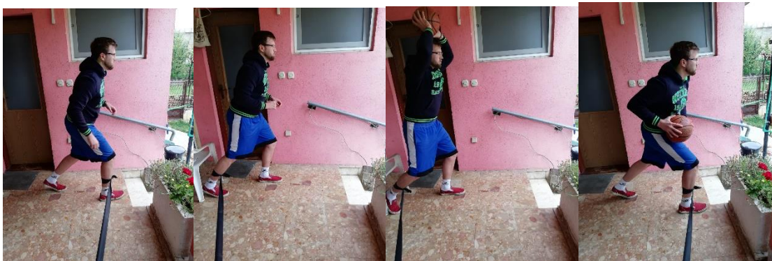
Slika 24. narušavanje stabilnosti pomoću gumene trake

U ovoj vježbi sportašu će biti potrebna pomoć trenera. Sportaš se nalazi u uspravnom položaju s loptom i zavezanom elastičnom trakom oko jedne noge. Trener stoji s bočne strane sportaša te je zadužen da prilikom iskoraka sportaša, povlači rastezljivu traku u različitim smjerovima i različitim intenzitetima. Prilikom iskoraka sportašu je dozvoljeno ili vođenje lopte ili sakrivanje lopte od zamišljenog protivnika. Sportaš iskoračuje naprijed, natrag ili u stranu. Potrebno je vježbu provoditi za početak 30 sekundi do jedne minute intenzivno, nakon čega slijedi pauza od 30 sekundi. Potrebno je vježbu ponoviti u 3 serije te dodatno otežavati kako osoba napreduje. Vježba pomaže sportašu da stvori reakciju na ne predvidive sile koje mogu na vanjski način utjecati na tijelo sportaša (slika 24.).