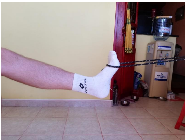
Slika 10. dorzlna fleksija u sjedećem položaju uz pomoć rastezljive trake