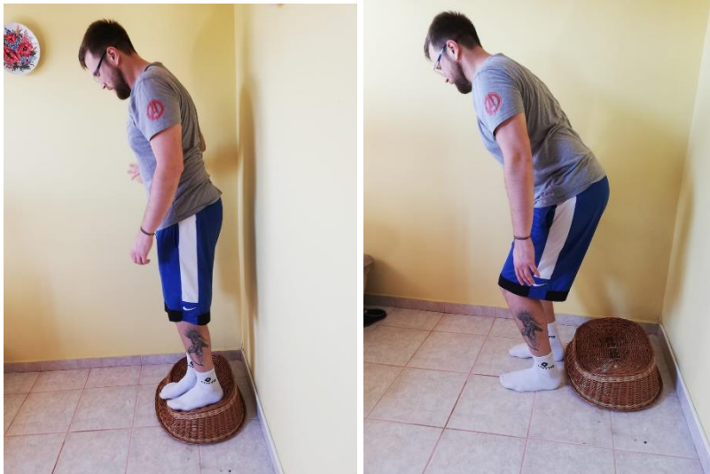
Slika 20. amortizacija doskoka

Sportaš se nalazi na niskom povišenju 10-15cm, cilj ove vježbe je poboljšati reakciju mišića na amortizaciju prilikom doskoka. sportaš sam diktira kada će ići u doskok. Nakon doskoka mora ostati u položaju nakon amortizacije barem 1-2 sekunde nakon toga se polako ispraviti te ponovno stati na povišenje. Potrebno je provesti 8-12 doskoka u 2-3 serije (slika 20.).