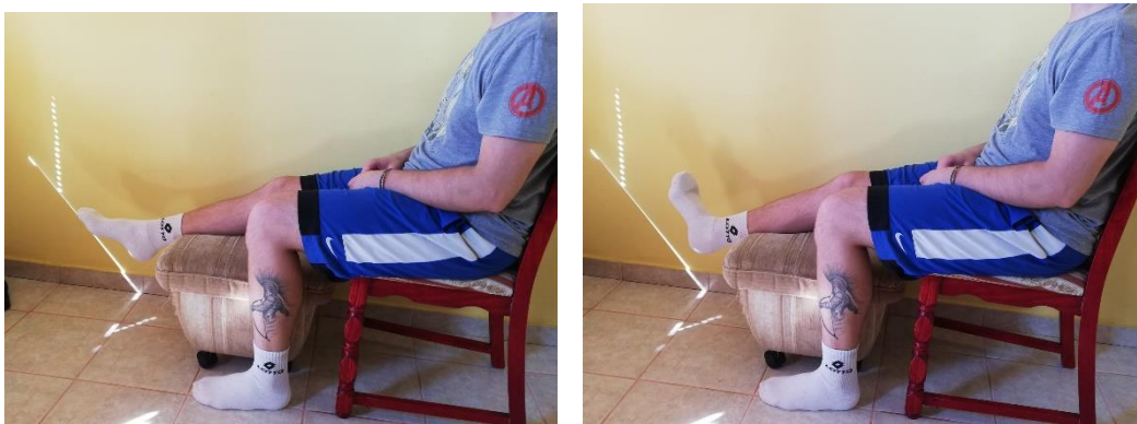
Slika 5. i 6. rotacija gležnja u jednu i drugu stranu s nogom na povišenju

Isto tako kao i prva vježba provodi se na stolici, ali u ovom slučaju sportaš drži nogu na malom povišenju od poda i postavlja nogu na to povišenje na način da mu je gležanj slobodan i da visi s te povišene površine. Kako je zglob slobodan, sportaš nesmetano može vršiti rotaciju stopala u jednu stranu i rotaciju stopala u drugu stranu. U svaku stranu treba napraviti 8-10 rotacije u 2-3 serije (slike 5 i 6).