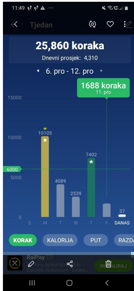
Slika 1. Primjer učenikovog izvješća o tjednom broju koraka