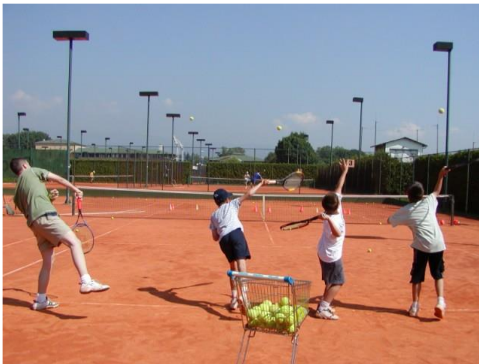
Slika 7. Škola tenisa – grupni rad

moгу pokazati pravilne teniske udarce. Djeca dobro reaguju na vizualne podražaje, stoga vizualni doživljaj igre u dječjem uzrastu ima vrlo veliku važnost. Jako je bitan pristup djetetu i primjena osnovnih didaktičkih principa kao što su: lakše – teže, poznato – nepoznato, konkretno – apstraktno, bliže – dalje itd.