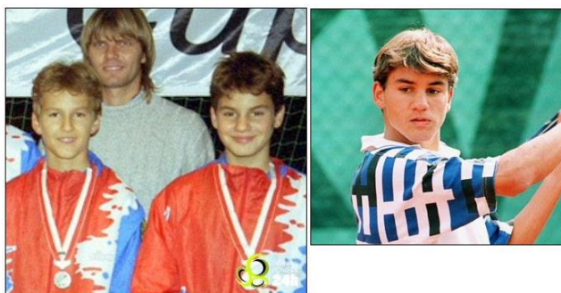
Slika 8. Roger Federer kao junior - s 12 godina je počeo ozbiljnije trenirati tenis, do tad je igrao nogomet. S 15 godina počima igrati ITF turnire, a sa 17 osvaja juniorski Wimbledon

Klasično srednjoškolsko obrazovanje se provodi u okviru dopisne škole. Obzirom da profesionalno obrazovanje zahtjeva znatna materijalna i tehnička sredstva, nužno je u takav proces obrazovanja uključiti samo izrazito talentirane igrače (Rupić, 2008).