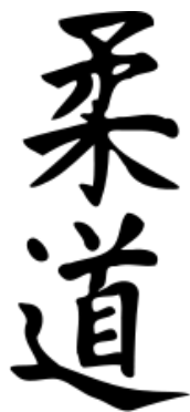
Slika 1. Judo na japanskom pismu.

Paraolimpijski sport u svom djelokrugu potiče i promiče sport osoba s invaliditetom. Judo kao dio paraolimpijskog sporta nastoji prema principima juda slijepim i slabovidnim osobama adaptirati judo kao vještinu.