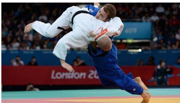
Slika 6. Judo na Paraolimpijskim igrama u Londonu 2012.

Uspoređujući judo borbe slijepih i slabovidnih judaša te judaša koji nemaju oštećenje vida može se primjetiti iz aspekta strukturalne analize u kineziologiji da ne postoje