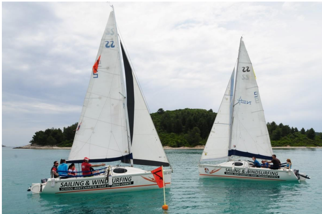
Slike 1. Jedrenje među plutačama